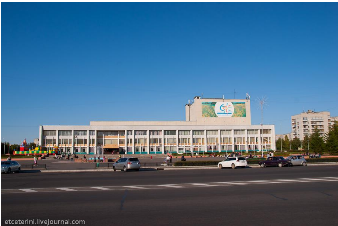
Музей Северска – здание конца 80-х годов. Экспозиция рассказывает об истории города и СХК (42)