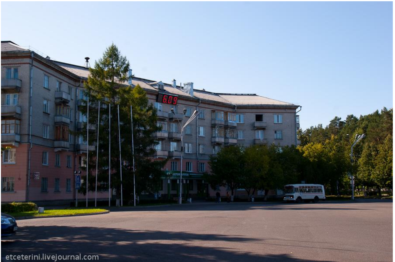
Коммунистический проспект в районе площади Ленина - чистый и уютный бульвар в зелени деревьев (16)