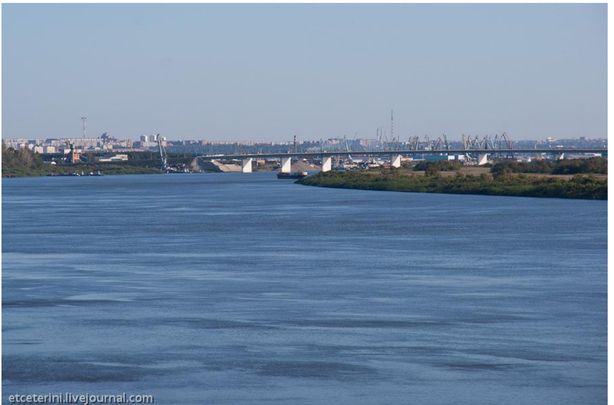
Внизу – северский пляж. В июле-августе здесь довольно тепло и можно купаться (36)