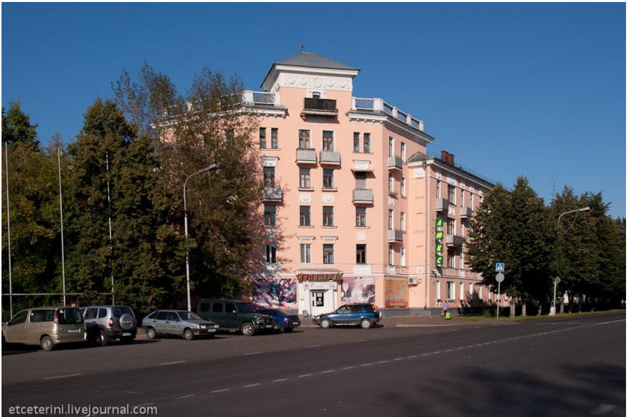
Дворец культуры (24)