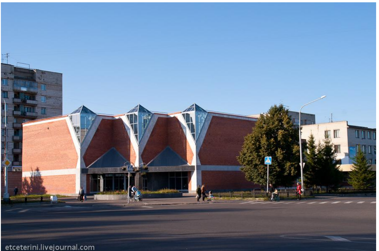
Ну и, наконец, наше время. Ледовый дворец в Северске построен уже в XXI веке (43)