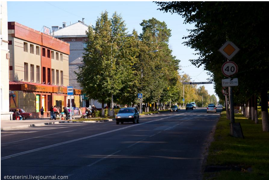
Боковые улицы еще более тихи и пустыньны (17)