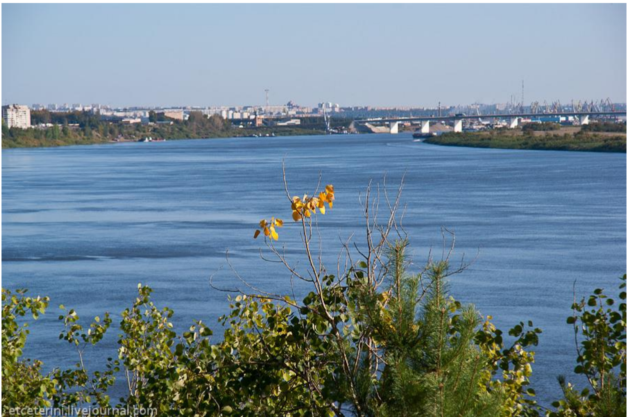
Автомобильный мост – уже часть Томска (35)