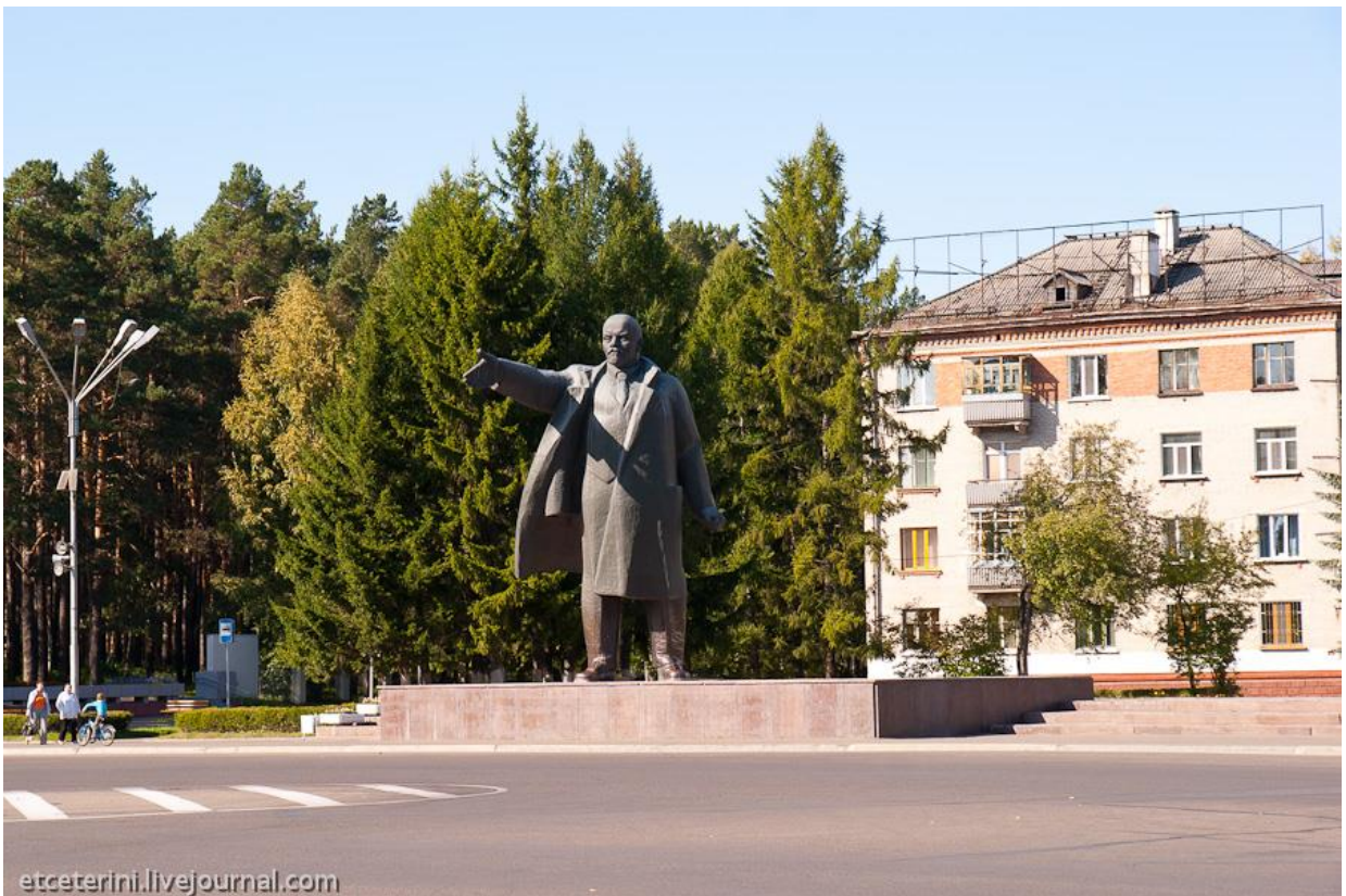
Рядом – здание администрации ЗАТО (14)