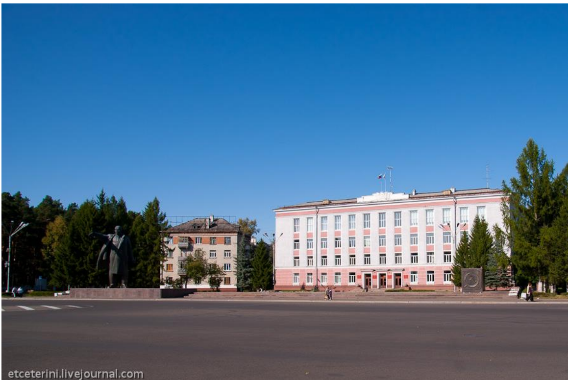
Жилые дома на другой стороне площади датируются концом 50-х - началом 60-х (15)