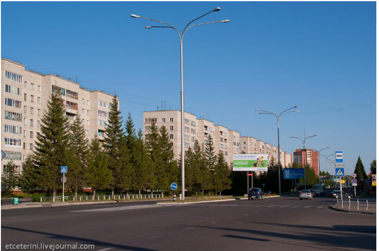
Гастроном «Центральный» (38)