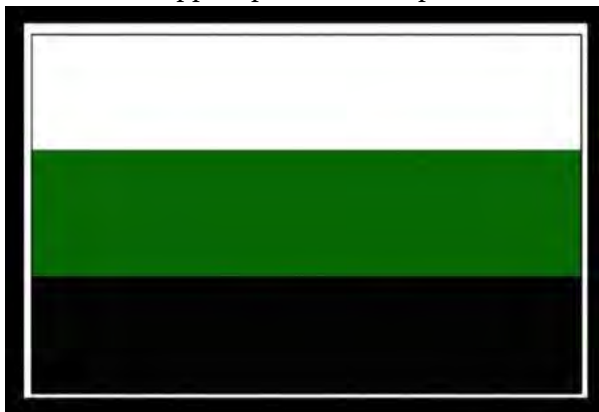
Флаг Тунгусской республики

Мятежники создали атрибутику своего национально-территориального образования.