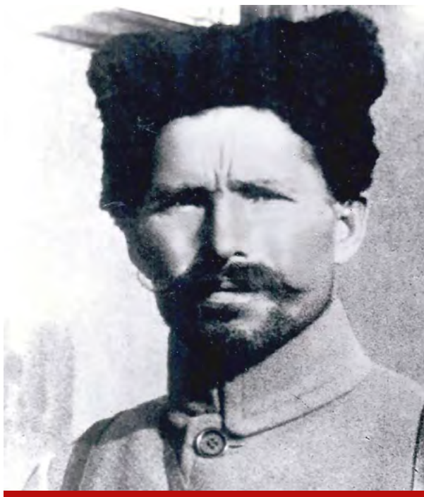
Василий Иванович Чапаев

Роман Дмитрия Фурманова и фильм братьев Васильевых посмертно сделали Василия Чапаева главным народным героем Гражданской войны. Смекалистый командир, вышедший из низов, беспрекословный авторитет для подчинённых, трагически погибший военачальник – эти черты способствовали грандиозному успеху чапаевского мифа (Сталин посмотрел фильм как минимум 16 раз).