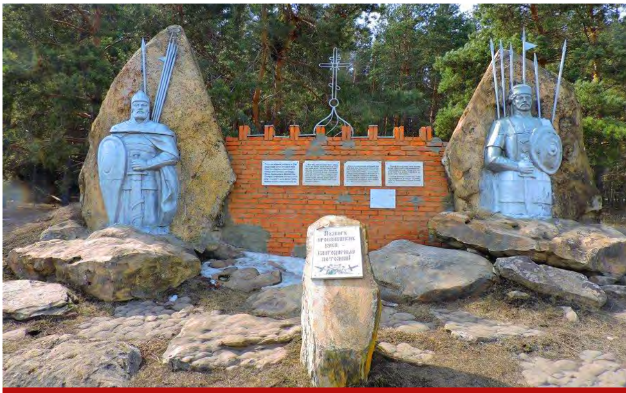
Мемориал «Судбищенская битва» в Орловской области

Сергей Соловьёв, «по обычаю – в одну сторону лук натянуть, а в другую стрелять – хан распустил слух, что идёт на черкасов», направил в пределы Русского государства 60-тысячное войско, в составе которого кроме крымских татар находились турки.