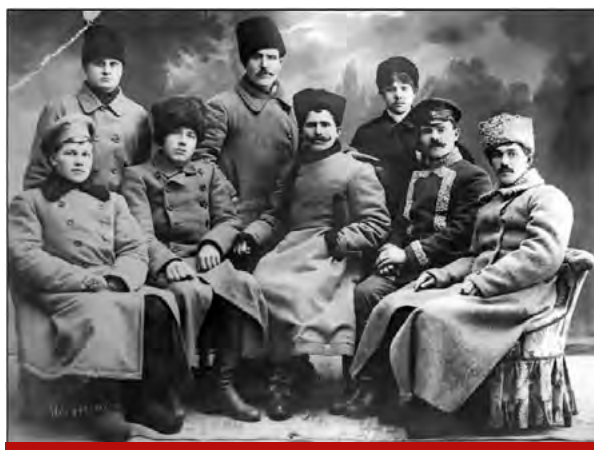
Чапаев в центре с командирами своей дивизии

– Мы уже показали таким, как вы, генералам, как надо воевать!