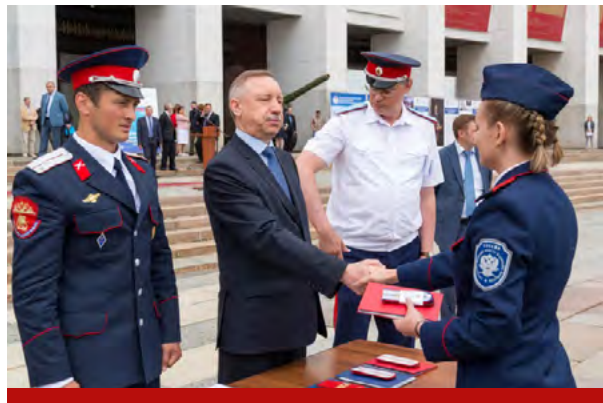
На фото выпускники Первого казачьего университета МГУТУ им. К. Г. Разумовского

Специалистов, которые обладают знаниями в области своей профессии и хорошо разбира-