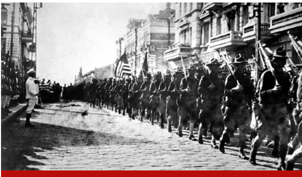
Американские войска во время парада перед зданием штаба Чехословацкого легиона во Владивостоке. 1918 год

О том, какую память оставили после себя военнослужащие США на Дальнем Востоке, – в материале РИА Новости.