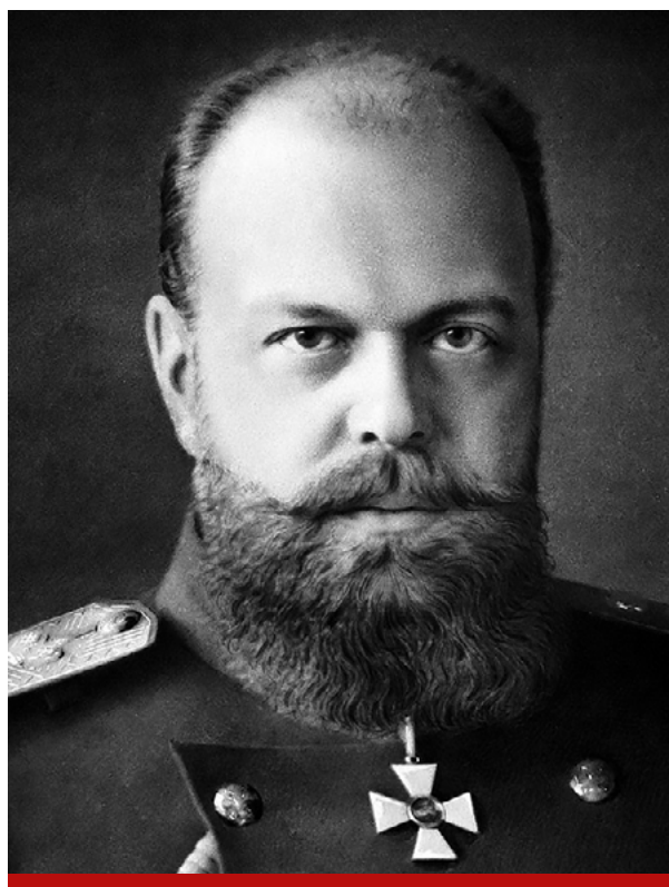
Александр III – император Всероссийский

Один знаменитый исторический эпизод случился более ста пятидесяти лет назад, когда русский император Александр III в своей загородной резиденции удил в свободное время рыбу. В этот момент к нему подбежал взволнованный адъютант и сообщил, что его поджидает французский посол, мол, очень спешит и требует немедленного рандеву. На что Александр III, не отрывая взгляда от поплавка, спокойно произнёс: «Когда русский царь удит рыбу, Европа может и подождать!».