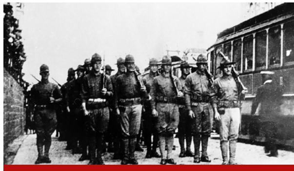
Американские войска на Дальнем Востоке. 1919 год