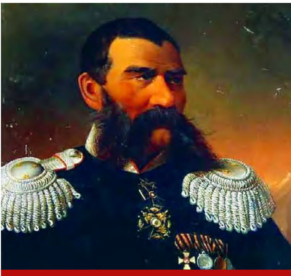
Я. П. Бакланов

Яков Петрович – легенда кавказской войны. Он был командиром казачьего кавалерийского полка, Походным атаманом Войска Донского. Когда командир со своими донцами мчался по ущелью, горцы спешили в укрытия. Да и было чего бояться: двухметрового роста, рябой, усатый да носатый казачина был видом явно не ангел. В бараньем тулупе, в огромной косматой папахе, сбитой на самый затылок, с длинными, развевающимися по ветру бакенбардами – ко-