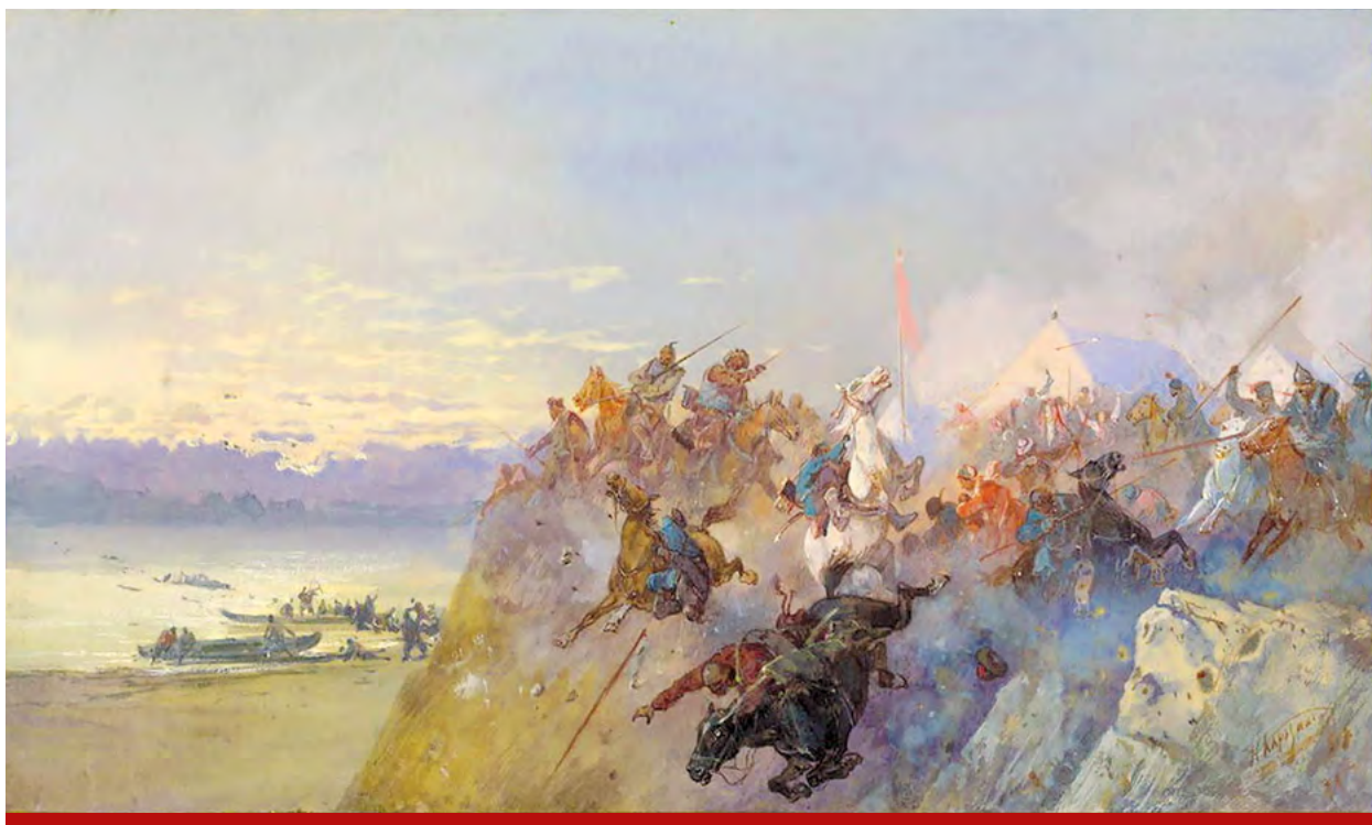
Художник Николай Николаевич Каразин «Последний кучумовский разгром 1598 года»

В 2012 году указом Президента Российской Федерации Владимира Путина были внесены изменения в статью Федерального Закона «О днях воинской славы и памятных датах России», согласно которым 1 августа – официальный День памяти российских воинов, погибших в Первой мировой войне 1914–1918 годов.