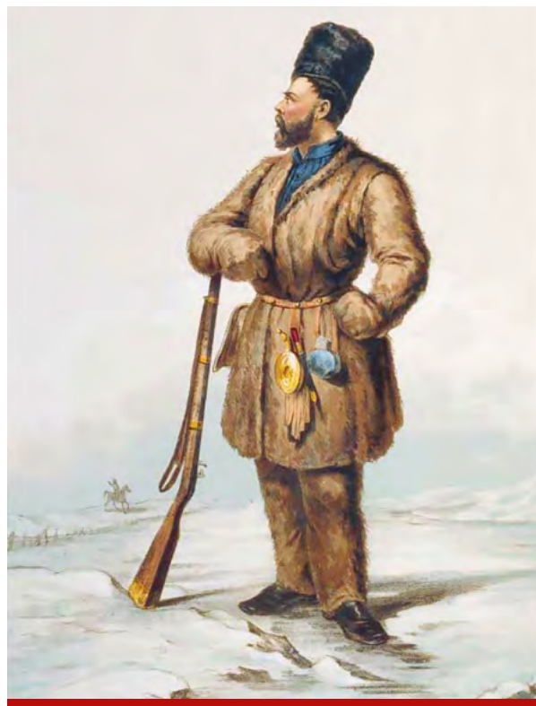
Сибирский казак 16–17 веков. Худ. Корнеев

Чтобы закрепиться на новых, необжитых территориях, отряды служилых казаков, вольных, гулящих и промышленных людей ставили укрепленные поселения, остроги. Тактика, выбранная казаками, была до предела проста и эффективна: бросок по рекам вперёд, закрепление на месте в виде поставленного острога с обязательным возведением крепкой бревенчатой стены с крепкими воротами, угловыми башнями. Внутри находилась изба воеводы, казармы для служилых людей, амбары для припасов, арсенальная изба, в которой хранились оружие и порох, и приказная изба – административная. Такие неказистые на вид крепости позволяли пережить зиму, основаться более прочно на новом месте, накопить силы для следующего рывка вперёд. А на новом месте снова ставили острог, накапливали силы, и снова через пару-тройку лет совершался бросок вперёд.