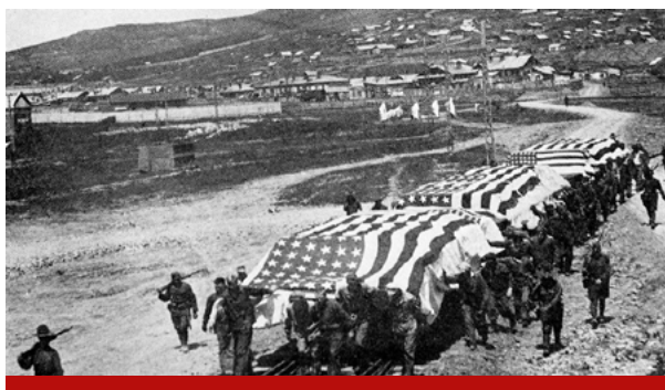
Американские интервенты везут платформы с погибшими во время боёв на Дальнем Востоке для дальнейшей транспортировки в США. 1920 год

«Находились ли союзники в войне с Советской Россией? Разумеется, нет, но советских людей они убивали, как только те попадались им на глаза; на русской земле они оставались в качестве завоевателей; они снабжали оружием врагов советского правительства; они блокировали его порты; они топили его военные суда. Они горячо стремились к падению советского правительства и строили планы этого падения. Но объявить ему войну – это стыд! Интервенция – позор! Они продолжали повторять, что для них совершенно безразлично, как русские разрешают свои внутренние дела. Они желали оставаться беспристрастными и наносили удар за ударом».