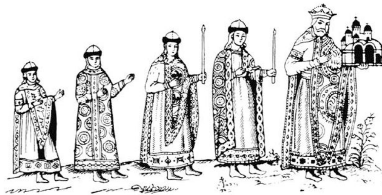
Фреска Ярослава Мудрого и его семьи в Софийском соборе Киева

Ярослав опять разделил Русскую землю между своими сыновьями. Нельзя было иначе сделать, такой уж обычай был. Князья непременно каждого сына наделяли. Да и пускай бы деньгами или каким-нибудь имуществом – так оно и следует, а то они и Русскую землю, как именье, делили. Старшему Киев отдадут, а другим иные города. Так и Ярослав сделал. Старший его сын Изяслав стал княжить в Киеве, второй, Святослав, – в Чернигове, третий, Всеволод, – в Переяславле. Ярослав велел старшему сыну любить младших, как детей, поступать с ними справедливо, оборонять и не обижать их. Младшим же сыновьям велел почитать старшего, как отца, слушаться во всём, не выходить из его воли. А в своём княжестве каждый волен был делать что угодно. Если случалось, что какой-нибудь князь умирал при жизни отца, не бывши сам князем, то сыновьям его либо совсем не давали уделов, либо давали самые малые. Такие князья назывались изгоями. А так случилось, что из этих изгоев многие были очень храбрые и за свою обиду захотели другим отомстить. Один из них, Ростислав, сын старшего сына Ярослава, Владими-