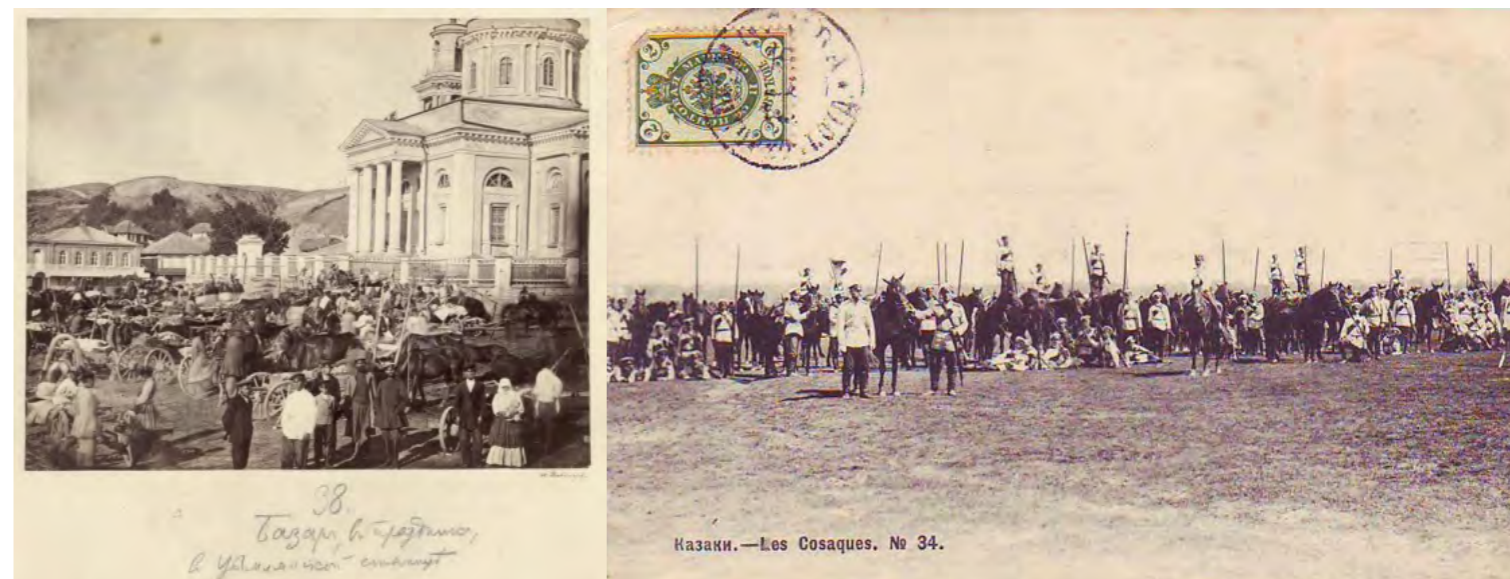
Казак. — Les Cosaques. No 34.