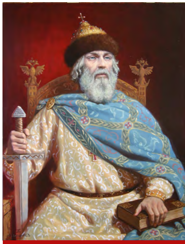
Великий князь Владимир Мономах

Был один князь, которого любили все русские, да и нельзя было не любить. Это Владимир, сын Всеволода, по прозванию Мономах. Когда отец его был великим князем, Мономах всех больше оборонял Русскую землю, двенадцать раз побил половцев, не любил отдыхать и не житья, всегда был готов встретить неприятеля, больше провёл ночей в поле, чем дома. Другие князья иногда из-за пустого ссорились, а Мономах только тогда воевал, если Русской земле был урон, свою же обиду всегда был готов простить, только бы не проливать христианской крови. И всем он был лучше их, не предавался никому невоздержанию, свято хранил клятвы, любил дружину и народ. Когда Всеволод умер, то киевляне хотели Мономаха посадить у себя великим князем, но он сказал, что это будет неправильно, потому что сын Изяслава, Святополк, старше его. Киевляне, делать нечего, согласились. И стал у них княжить Святополк второй.