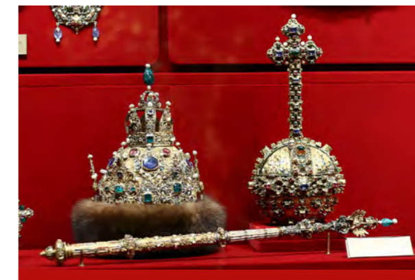
Шапка, держава и скипетр Мономаха

Когда умер Святополк, то, хотя Олег Святославич был старше Мономаха, однако киевляне и слышать не хотели, чтобы у них был великим князем кто иной, а не Владимир Всеволодович, и сейчас же послали звать его к себе. Он сперва было не поехал, но в Киеве народ принялся грабить евреев, а потом послали сказать Владимиру: «Если не прийдешь, много зла будет, и княгиню Святополкову, и бояр, и монастыри ограбят». Тогда Мономах вступил в Киев и стал великим князем. При нём никто не смел своевольничать. Не только русские князья, но и чужеземные государи почитали его. Греческий император Алексей прислал ему в подарок крест животворящего древа, царский венец, бармы, т. е. оплечья, сердоликовую чашу, которая прежде принадлежала римскому кесарю Августу, золотые цепи и другие драгоценности. Эти подарки привёз в Русскую землю митрополит Неофит, и провозгласил великого князя Владимира царём. В Москве, в палате, которая называется Оружейною, и теперь ещё хранятся золотая шапка (или корона), цепь, бармы, держава и скипетр Мономаха. Всё это из золота и украшено драгоценными камнями. Владимир Всеволодович был по матери из гре-