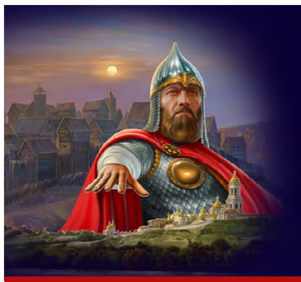
Князь Юрий Владимирович Долгорукий

Игоря остался родной брат Святослав, князь Новгород в Северной земле, и двое двоюродных: Изяслав и Владимир Давидовичи, князья черниговские. Святослав очень любил брата, непременно хотел освободить его из неволи, и сперва просил помощи у черниговских князей, которые только пять дней тому назад поклялись, что будут стоять за Игоря Давидовича. Они обещали помощь, а сами хотели схватить Святослава. Однако это им не удалось, и он нашёл себе помощников. Первые пришли к нему половцы, которых князья были дяди его жены. Потом вместе с ним пошли на Изяслава ещё двое сильных князей: дядя Изяслава, князь ростовский и суздальский Юрий Владимирович, и Владимирко, князь галицкий.