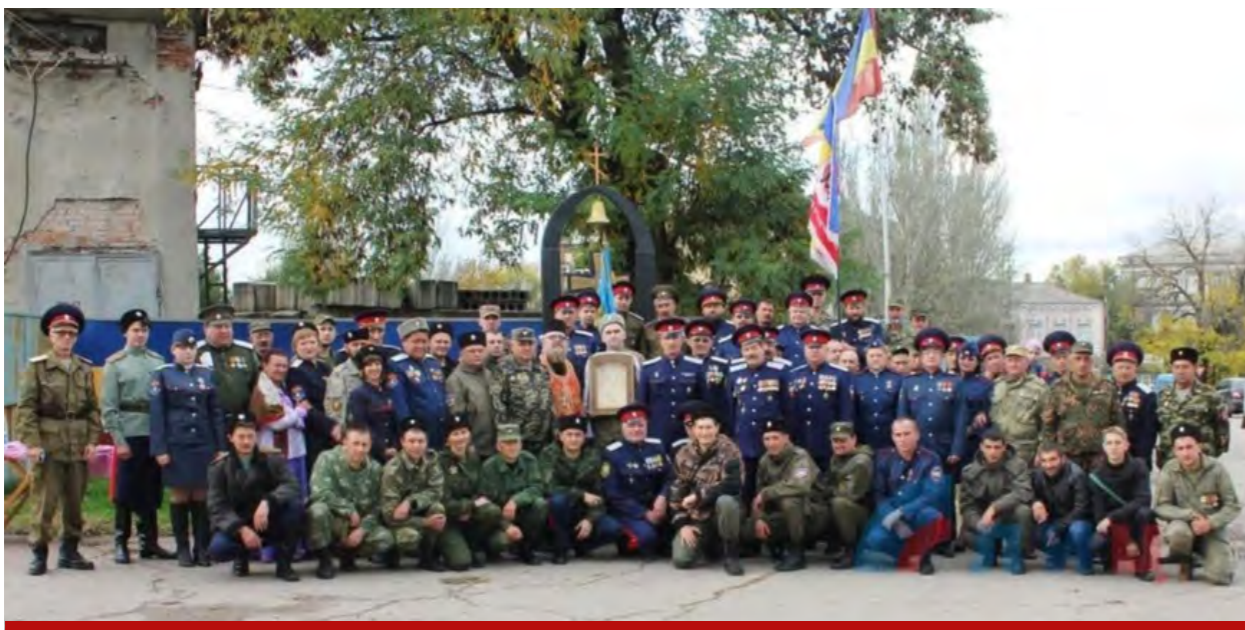
Нереестровые казаки Всевеликого Войска Донского в ополчении на Донбассе

нейший вопрос – сохранение казачества как уникального мирового явления. На сегодня это одна из немногих сил, готовая в случае опасности встать на защиту России. Гастарбайтер вряд ли будет рисковать жизнью за нашу страну.