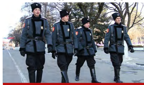
Казачья охрана райсудов в Москве

Получается так, что уже на протяжении 12 лет действия этого закона ни один казак на настоящую госслужбу так и не попал. Выходит, как ни крути, казаков обманули. Пообещали им госслужбу, те клюнули на это дело, вступили в официально зарегистрированное казачье общество и написали заявление о готовности её нести. И вот уже 12 лет казаки ждут положительного ответа от силовых органов. До сих пор ждут... Максимум, на что им дают добро – создание народных дружин в казачьей форме.