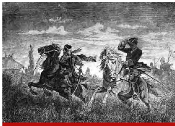
Бегство Карла XII и Мазепы

Гетман И. И. Скоропадский «со всем своим войском» подошёл по требованию царя к Семёновскому лагерю с застав на реке Псёл к вечеру 24 июня. Только на следующий день после подхода украинских казаков Пётр I решил передвинуть армию ближе к расположению шведов на новую позицию к северу от деревни Яковцы – приблизительно в пяти верстах от центра шведского лагеря.