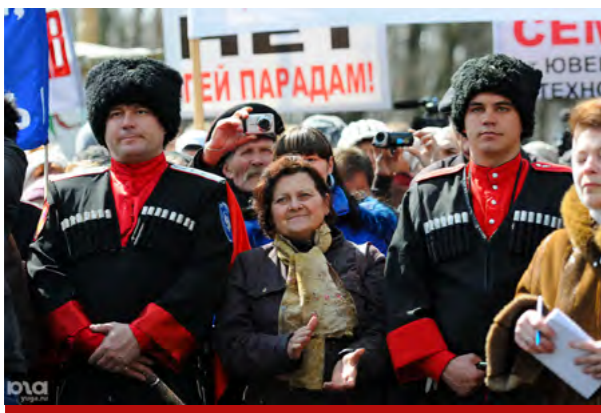
Митинг против действий группы Pussy Riot и в поддержку духовности. Краснодар, 31 марта 2012 года

Вы один из тех, кто считает казачество отдельным народом, ратуете за этническую казачью идентификацию. Расскажите, как вы относитесь к высказываниям вашего преемника атамана Долуды. Он, например, в прошлом году сказал, что нужно, чтобы на Кубани был миллион казаков. А лучше – два. Насколько реально вырастить двухмиллионный народ?