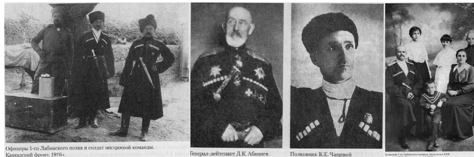
Офицеры 1-го Лабинского полка и солдат нестроевой команды. Кавказский фронт, 1916 г.