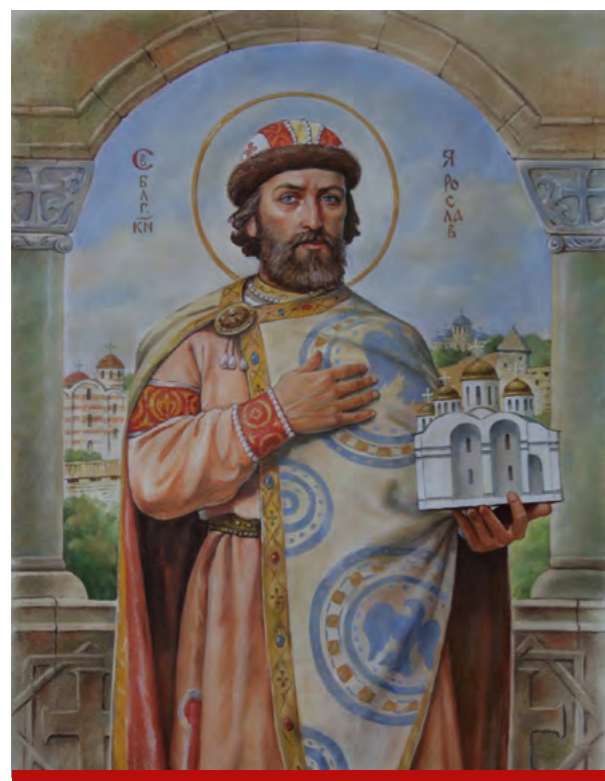
Великий князь Ярослав Мудрый

Ярослав опять разделил Русскую землю между своими сыновьями. Нельзя было иначе сделать, такой уж обычай был. Князья непременно каждого сына наделяли. Да и пускай бы деньгами или каким-нибудь имуществом – так оно и следует, а то они и Русскую землю, как именье, делили. Старшему Киев отдадут, а другим иные города. Так и Ярослав сделал. Старший его сын Изяслав стал княжить в Киеве, второй, Святослав, – в Чернигове, третий, Всеволод, – в Переяславле. Ярослав велел старшему сыну любить младших, как детей, поступать с ними справедливо, оборонять и не обижать их. Младшим же сыновьям велел почитать старшего, как отца, слушаться во всём, не выходить из его воли. А в своём княжестве каждый волен был делать что угодно. Если случалось, что какой-нибудь князь умирал при жизни отца, не бывши сам князем, то сыновьям его либо совсем не давали уделов, либо давали самые малые. Такие князья назывались изгоями. А так случилось, что из этих изгоев многие были очень храбрые и за свою обиду захотели другим отомстить. Один из них, Ростислав, сын старшего сына Ярослава, Владими-