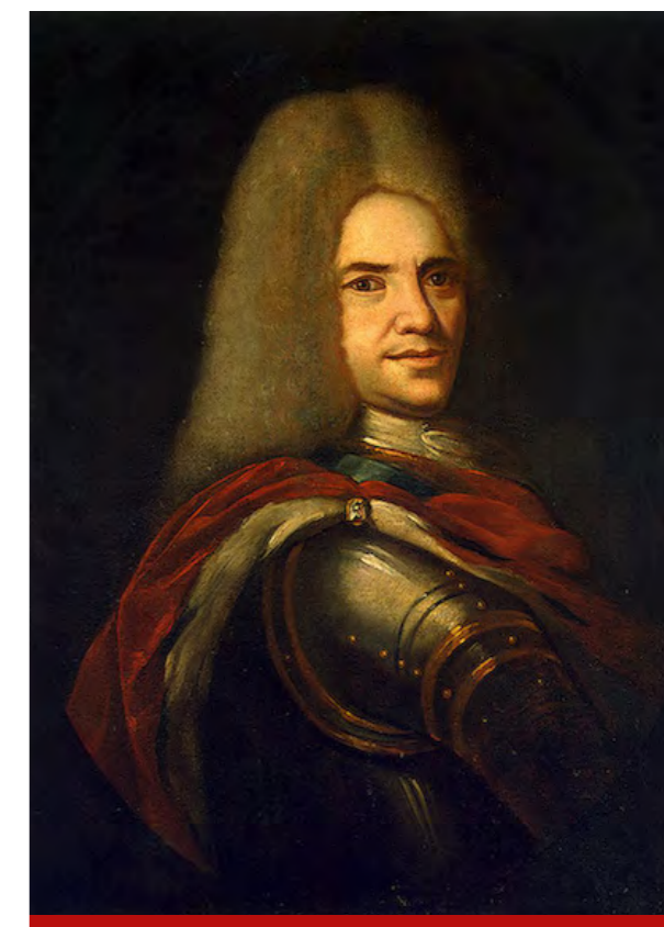
Г. Ф. Долгоруков

Ни для российской правящей верхушки, ни для Мазепы не являлись тайной ненадёжность клятвы «таких своевольных» запорожских казаков, ни их завышенная самооценка, ни отсутствие стойкости в полевом бою, ни склонность к грабёжам, мятежам и измене. В случае битвы регулярных армий мятежные казаки не имели большой ценности – непрофессиональные войска не были предназначены для правильного полевого боя. Бывший российский посол в Речи Посполитой, полномочный министр Г. Ф. Долгоруков 22 января 1709 г. предлагал в письме царю не призывать под Полтаву для борьбы со шведами запорожских казаков. Напротив, представляя «оных своевольников воровство», он считал важным «таких своевольных удерживать» в Запорожье. Полторы тысячи запорожцев, шедших тогда на соединение с русскими войсками, Г. Ф. Долгоруков считал наилучшим «порознь разделить, понеже в оных, кроме своевольства и опасности, лишней службы нет». Сам Мазепа писал «о запорожцах, представляя неверность и шатость их и советуя о усмирении и разорении оных». Такие писания Мазепы начальнику Посольского приказа Ф. А. Головину (1650–1706) царь потребовал отыскать в Москве в начале 1709 г.