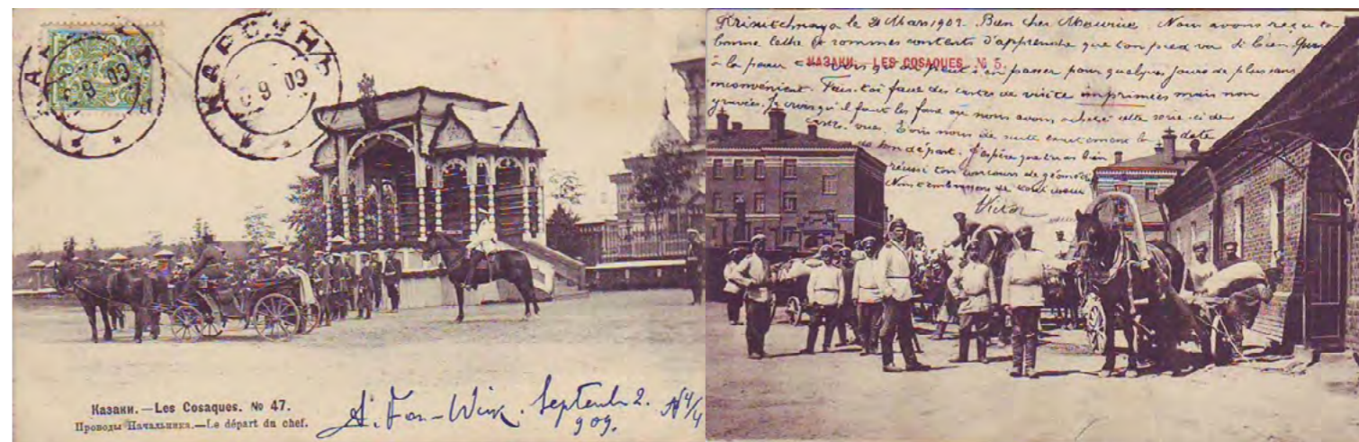
Казак. — Les Cosaques. No 47. Проводы Начальника. — Le départ du chef. A. For-Win. Septembre 2. 1909.