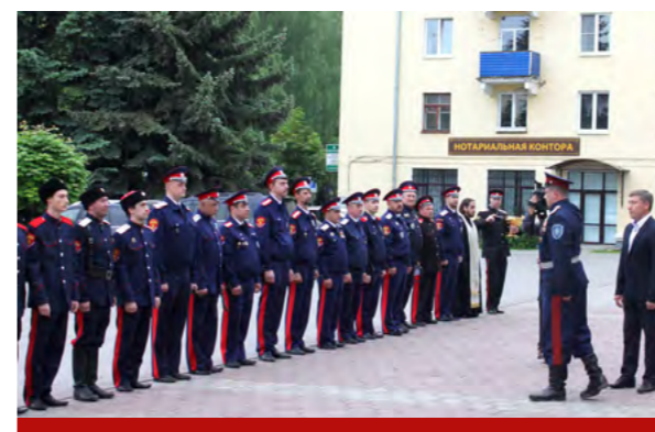
Казаки охраняют порядок в День города в Воскресенске

Имеют место и манипуляции с численностью казачьих объединений. Для входа в реестр надо подтвердить определённое количество членов. На том же Совете при президенте отмечалось, что только 47 % окружных казачьих обществ прошли регистрацию, среди первичных («хуторских») зарегистрировано 64 %.