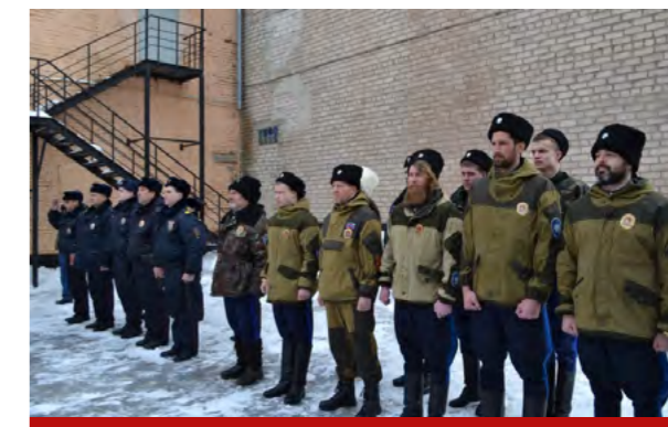
Казаки и полицейские на страже общественного порядка в Оренбурге

Первоначально у меня с ними были хорошие контакты, но сейчас уже не приглашают на совместные беседы. Был издан приказ за подписью директора ФАДН о создании экспертно-консультативного совета по делам казачества, был составлен список кандидатов. Голосование по членам в совет получилось скандальным – выявили множество подтасовок – и в итоге процесс затих. Не буду приводить другие факты, но понятно, что этим ребятам в Агентстве достался кусок не по зубам. Может быть, я слепой, но последнее время оттуда вообще не приходит информации по казачеству.