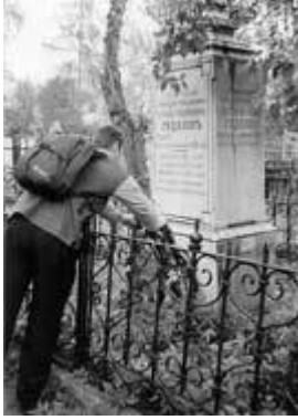
фото из семейного архива Пол Френсис Гадалов