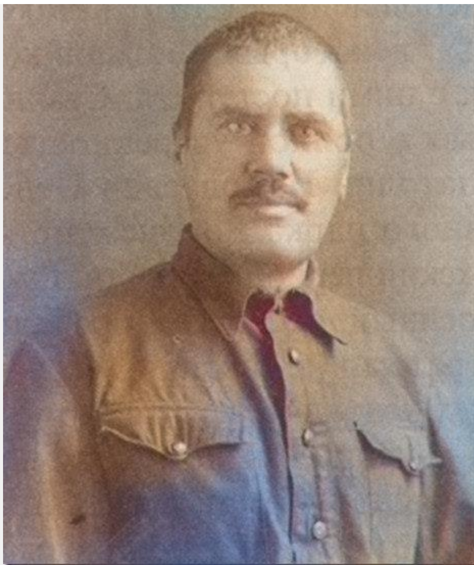
Анатолий Николаевич Пепеляев