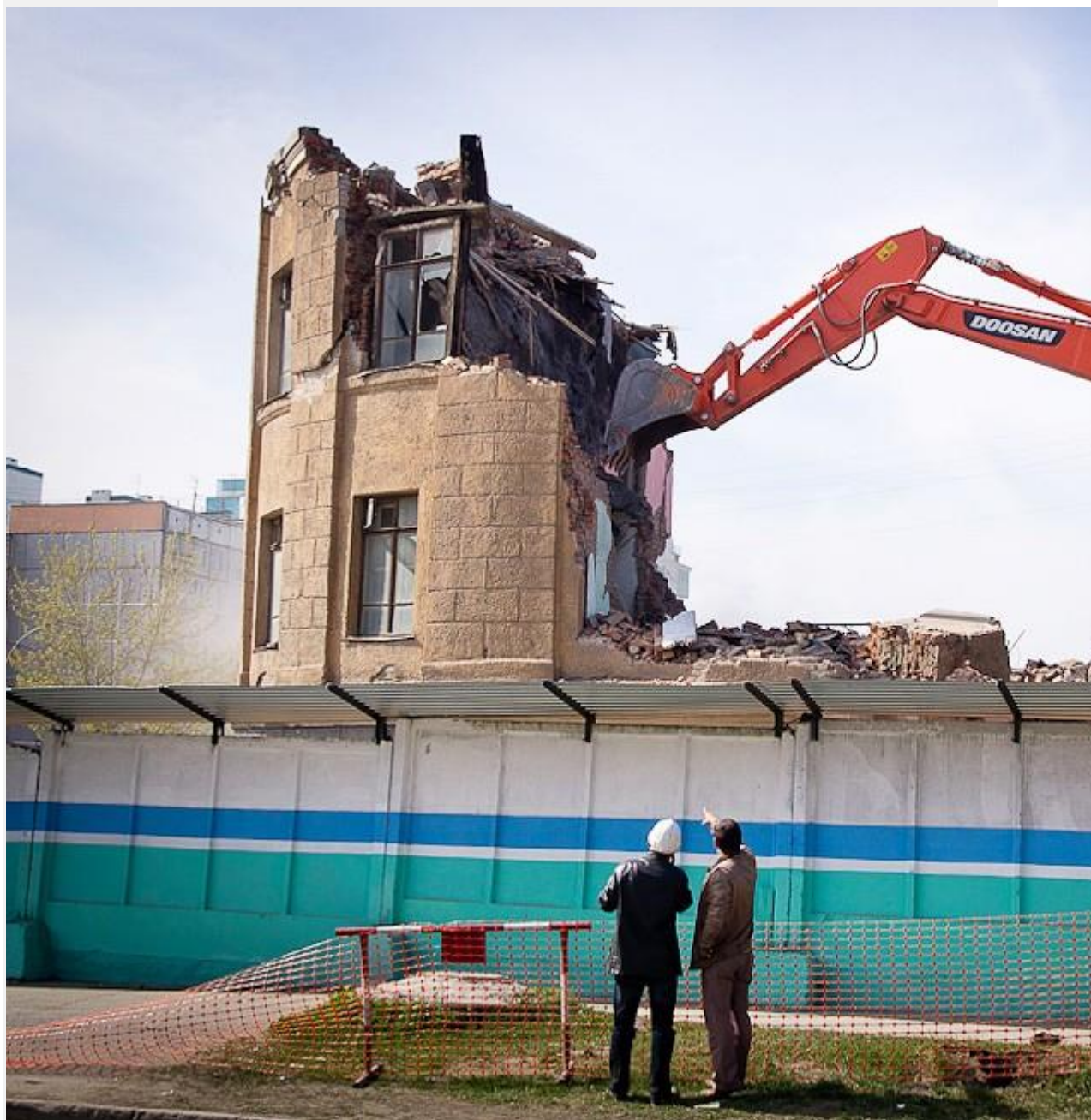
Снос здания бывшей пересыльной тюрьмы. Новосибирск, угол ул. Нарымской и ул. 1905 года.