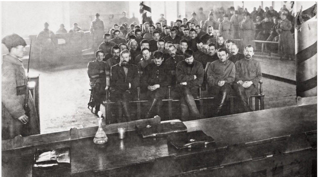
Чита. Январь 1924 года. Подсудимые в зале суда. Третий слева – генерал-лейтенант А. Пепеляев.

В показаниях, которые Пепеляев давал советским следователям, есть такие записи о последних часах существования СДД: "Как-то сразу мелькнула мысль, что преступно вести бой бесцельно, лишь для сохранения собственной жизни" . Эти слова нужно высечь в граните. Выдающийся воин в одной строчке дает глубокое обоснование смысла войны, воинского долга, вообще существования вооруженных сил - в совершенно Евангельском духе. Ради шкурных интересов воевать не только бессмысленно, но и преступно. Война имеет оправдание лишь в целях, уходящих в Вечность, и никак иначе. Неукротимая волна Промысла вытащила генерала Пепеляева из тихого Харбина, повлекла его и его бойцов в морозы и снега, но у самых ворот Якутска остановила братьев-дружинников и отбросила их обратно к неприветливому Охотскому морю. Далее, на протяжении полутора десятков лет уделом А.Н.Пепеляева стали переживание своего падения, военной и идеологической катастрофы, крушения надежд, растерянность, боль и тревога об оставленных родных, непонимание, а то и презрение белой эмиграции. И к концу земного пути - смутные огоньки надежды на встречу с семьей, краткий период иллюзорной полусвободы под неусыпным надзором НКВД, трогательно-наивные попытки скопить денег для обеспечения переезда супруги и сыновей.