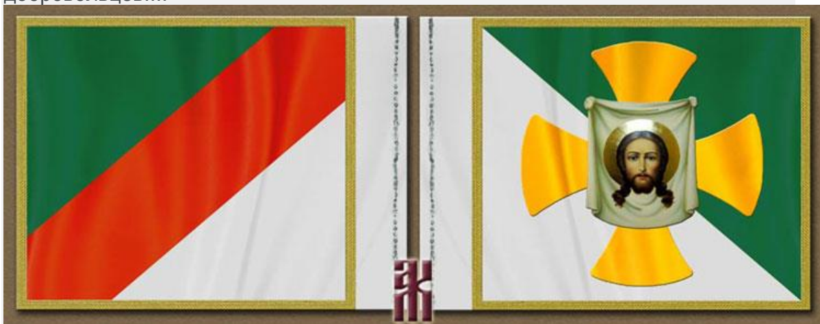
Знамя Сибирской добровольческой дружины генерала А.Н. Пепеляева.