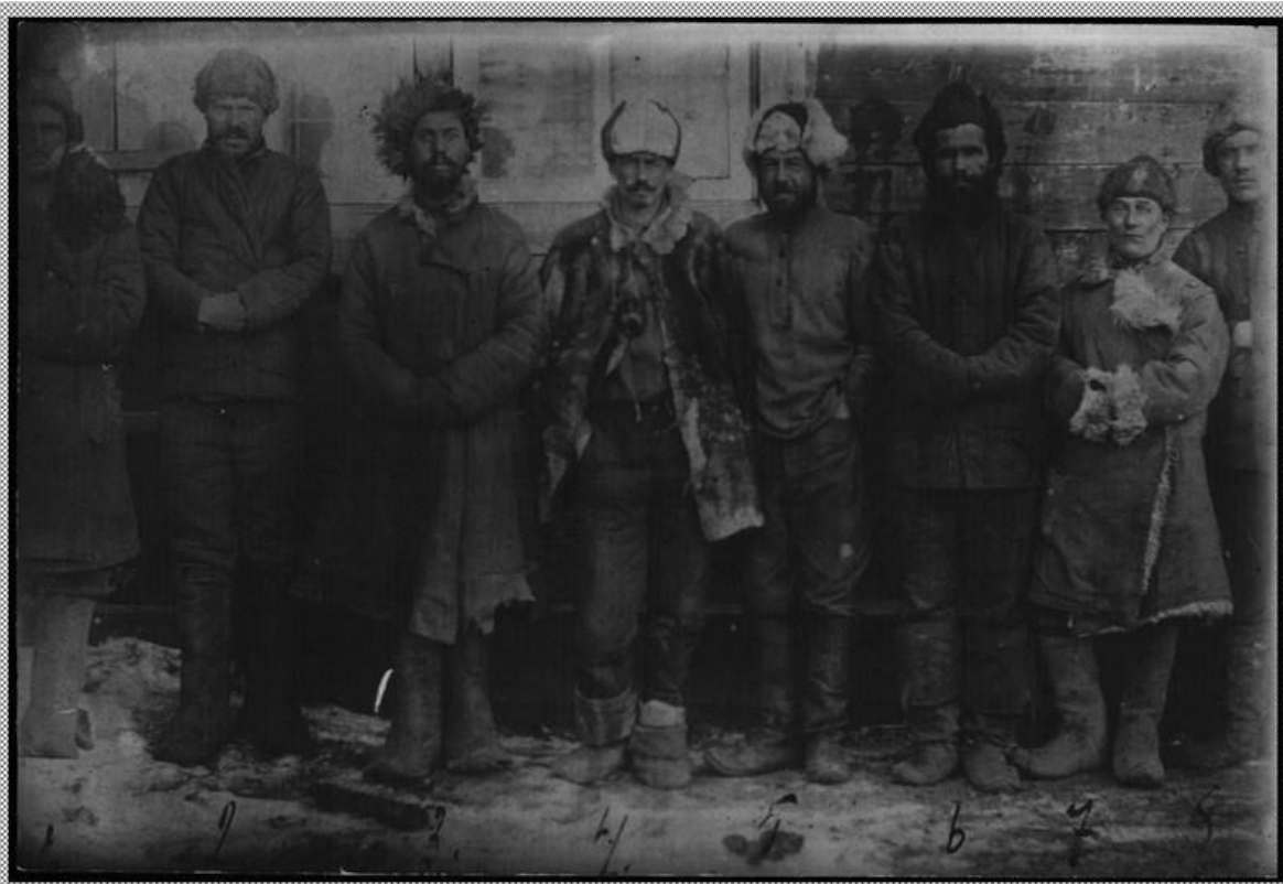
Группа пепеляевских офицеров сразу после пленения в Аяне (июнь 1923 г.).

19-20 июня 1923 г.: "Обращение хорошее. Оскорблений нет, люди порядочные, я рад, что не пролилось крови. О себе не боюсь, на все воля Бога ". Военачальник, радующийся о непролитии крови. Белый генерал, среди всеобщего озверения Гражданской войны не учинивший ни одного расстрела, не проводивший ни одной насильной реквизиции имущества. Выдающийся полководец, смиренно доверяющий личному дневнику мысль о том, что он "в душе человек невоенный".