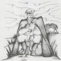
Рис. А. Любавин

К концу 19-го положение Колчака и его правительства стало просто отчаянным. От него отвернулись практически все бывшие сторонники. Важную роль в этом сыграл категорический отказ адмирала пере-