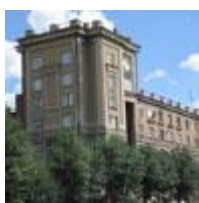
Жилой дом Соцгорода «Сибметаллстрой». Новосибирск ул. Станиславского, 7

Характерным в этом отношении и, пожалуй, лучшим в авторском списке В.М. Тейтеля является «жилой комбинат левобережного города», «жилой дом Соцгорода «Сибметаллстрой», ныне по