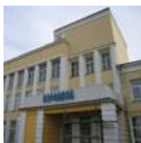
Новосибирский Аэроклуб. Клуб юных пилотов