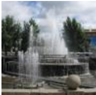
Фонтан-каскад в Первомайском сквере

«За благоустройство города. Горзеленстрой в этом году должен закончить работы по озеленению в Первомайском сквере. Здесь будет проведён водопровод и сооружён фонтан-каскад. Над проектом последнего работает архитектор-художник т. Тейтель».