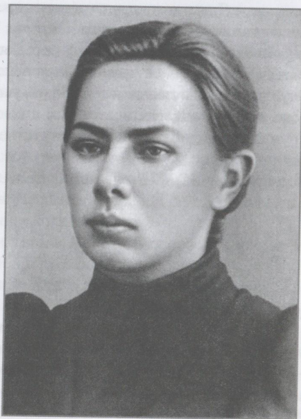
Н.К. Крупская, 1898 г.