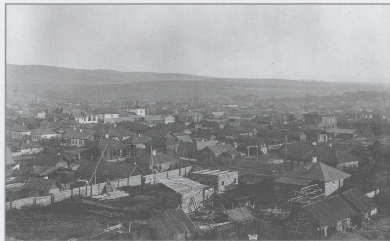
г. Минусинск, конец 1920-х гг.