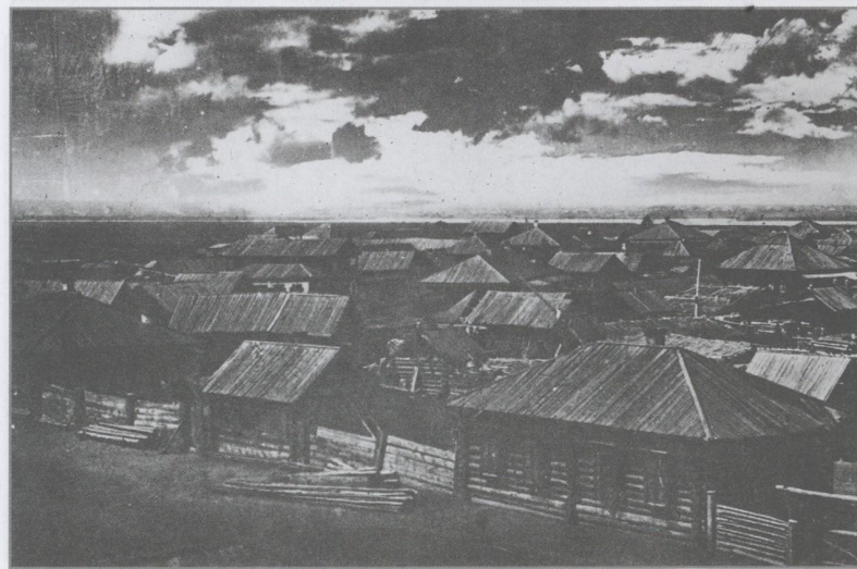
с. Шушенское, 1920-е гг.