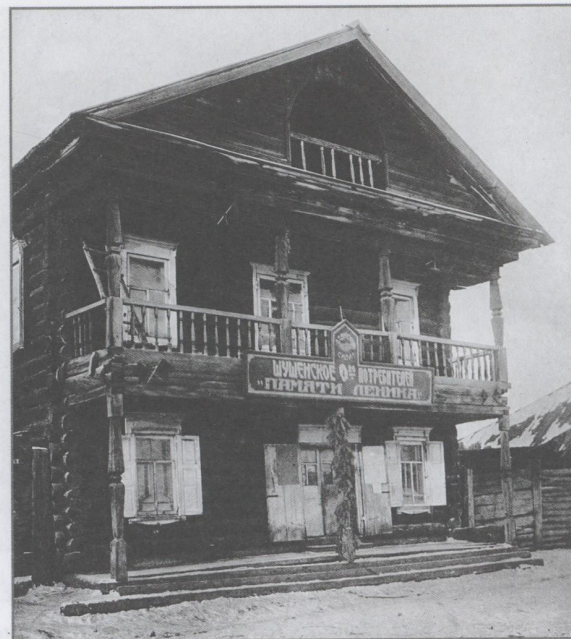
Дом П.Т. Строганова, конец 1920-х гг.