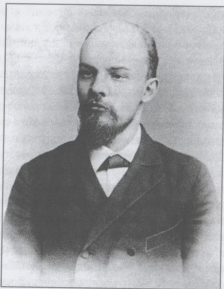
В.И. Ленин, 1897 г.