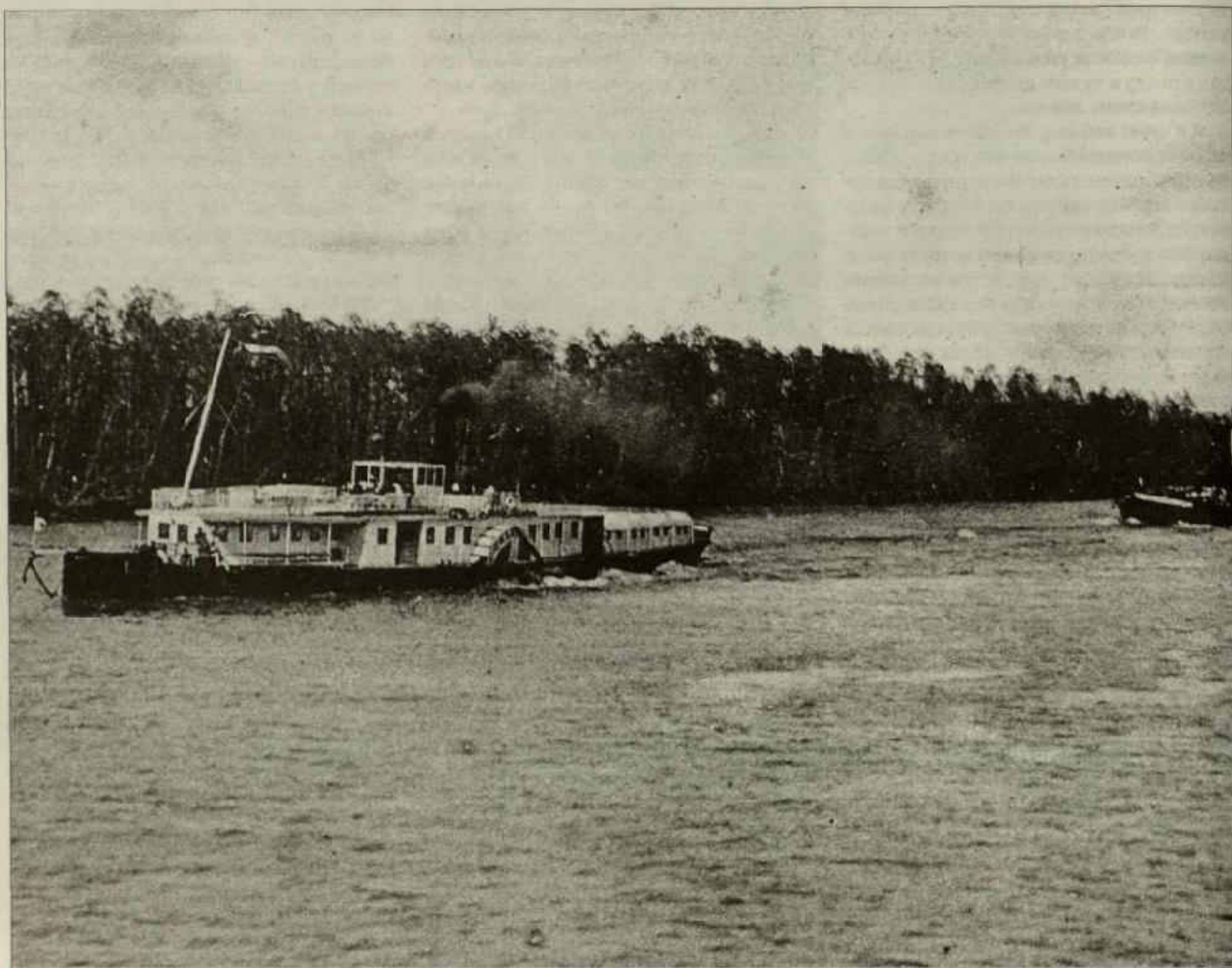
Пароход на реке Оби (снимок до 1917 года).