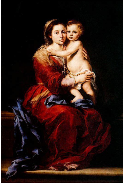
Мурильо “ Дева Мария с чётками” “La Virgen del Rosario” 1640-50гг.