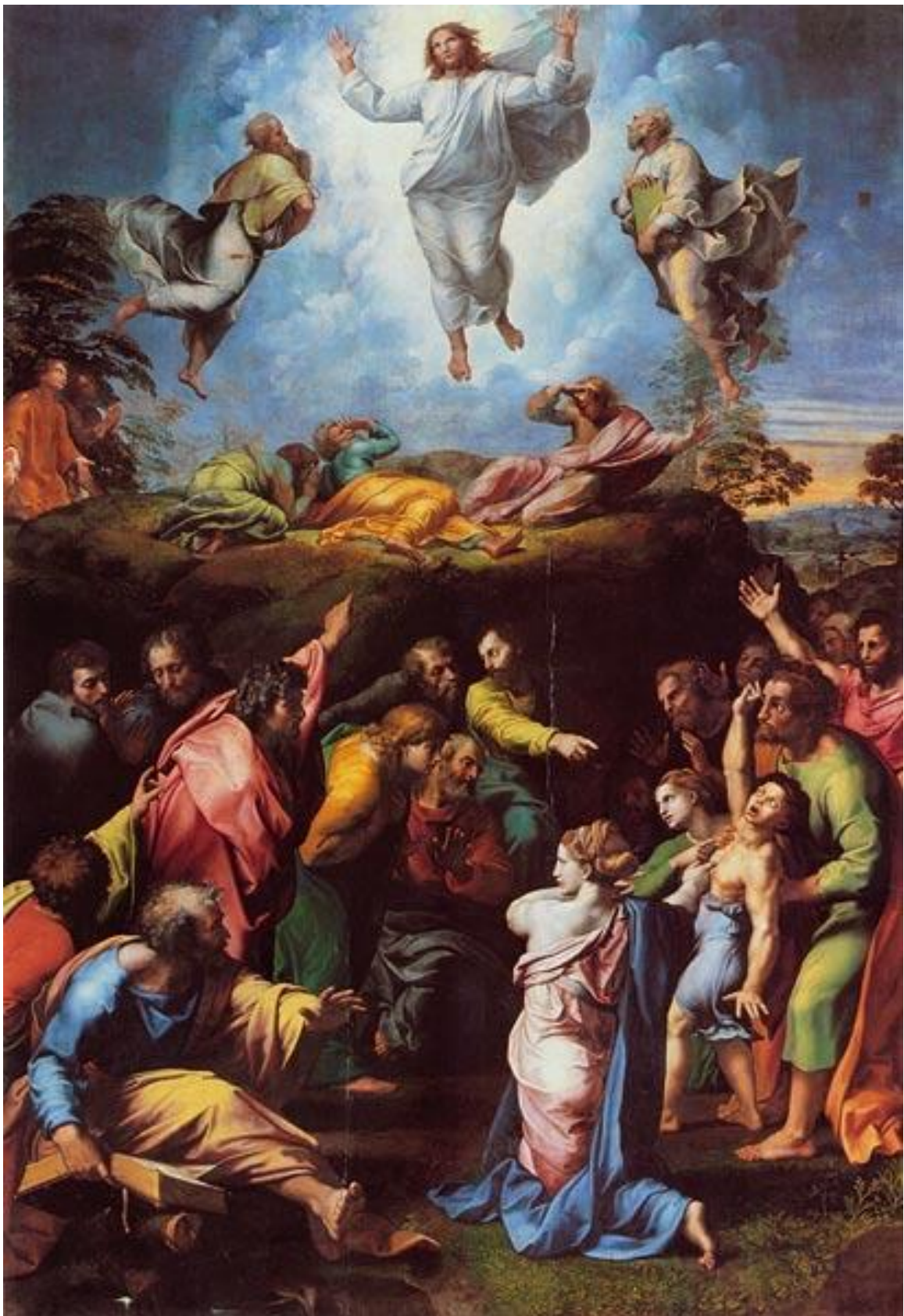
Рафаэль Санти “Преображение”