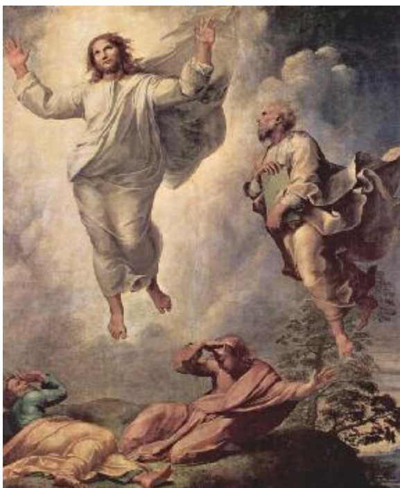
Рафаэль Санти “Преображение” - фрагмент