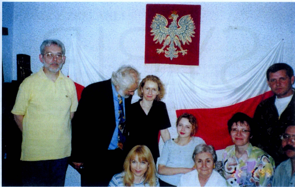
Foto 7. Część polskiej delegacji na spotkaniu w Klubie „Biały Orzeł”.

z podwórka do domu, Tolu! – wołaczem, którego w języku rosyjskim się nie używa. Powojenny pobyt w Tomsku wzbogacił moje dorosłe życie o kontakt z pracownikami naukowymi Uniwersytetu, z członkami Domu Polskiego, odwiedzinami pani Niny i innych u nas w Polsce, a to bardzo trudne dla nas sybirskie miasto chorób i głodu przestało być tylko miejscem zesłania!