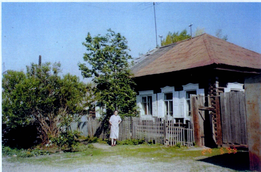
Foto. 3. Dom podobny do poszukiwanego