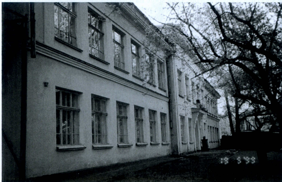
Foto 4. Moja dawna szkoła po remoncie.