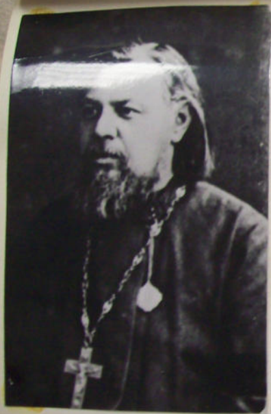
С.А.СОМЕРТИНСКИЙ ок. 1900. Копия