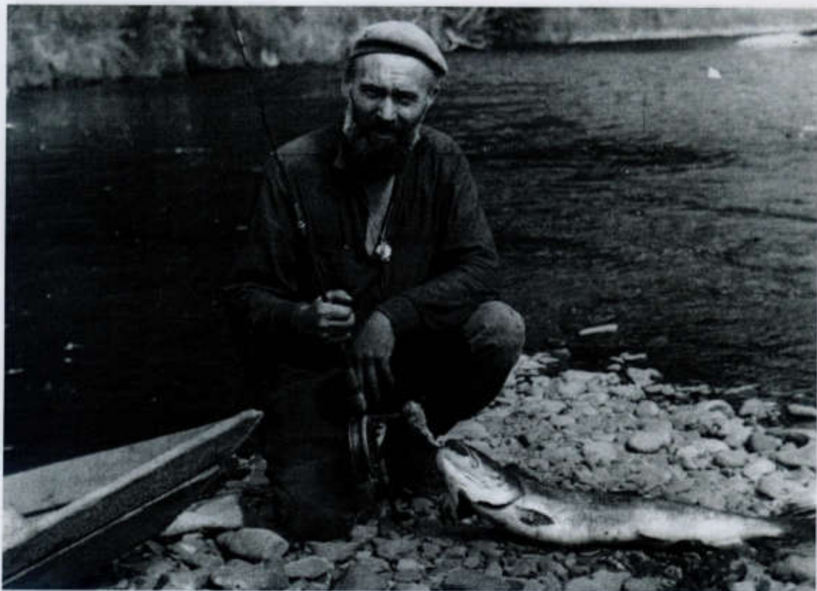
Юрий Болеславович Пукинский. 1976 г.