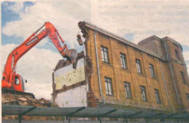
Тысячи арестованных были замучены в этих стенах.

Между тем именно новосибирское УНКВД сфабриковало рекордное в стране количество дел на никогда не существовавшие антисоветские организации. Об этом стало известно из архивных докладов комиссии ЦК КПСС по установлению причин массовых репрессий в 1956 году. Были арестованы сотни тысяч местных жителей. В 1937 году прошла самая массовая зачистка, под которую попали бывшие офицеры, торговцы, просто зажиточные крестьяне. После ареста более 55 тысяч «врагов советской власти» на улицах Новосибирска стало малолюдно. Местное отделение НКВД рапортовало, что на Куз-