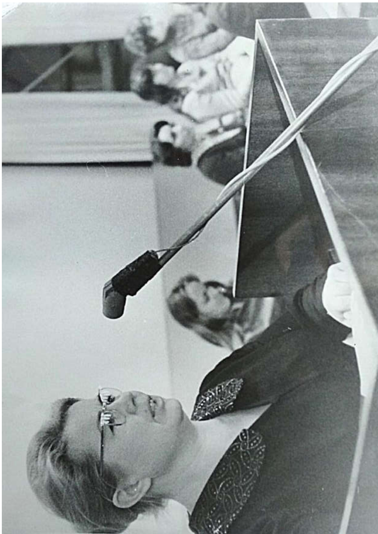
Занятие факультета «Международной жизни» в Омском авиационном техникуме