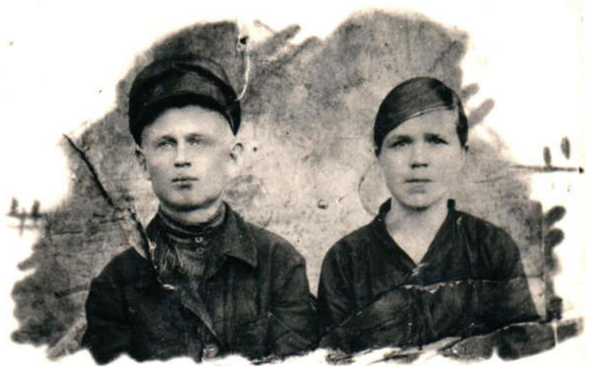
Наши родители. Мать была беременна мной. В эту пору у них отняли дом, хозяйство за неуплату единого налога.