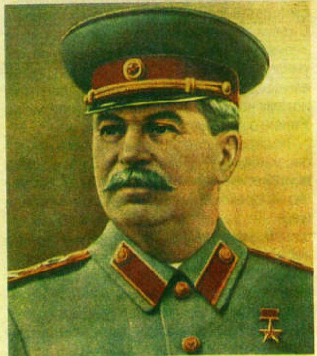
И. Сталин создал государство, которое держалось только на насилии.

Все успехи СССР при Сталине, которые никто не подвергает сомнению, были достигнуты слишком высокой ценой. Мы продолжаем платить её и сегодня. Распад СССР - прямое последствие деятельности Сталина. Он создал государство, которое держалось только на насилии и не смогло существовать за счёт других связующих средств. Прекратилось насилие, и государство стало распадаться на части. Так что высшему суду, если бы он существовал, я бы порекомендовал признать Сталина виновным. Да, «со смягчающими обстоятельствами», но однозначно виновным в преступлениях против собственного народа.