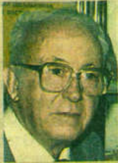
Рой МЕДВЕДЕВ, историк, писатель

С прихода Сталина к власти прошло почти 90 лет, с момента его смерти - 60 лет, но общество никак не может дать ответа на этот проклятый вопрос.