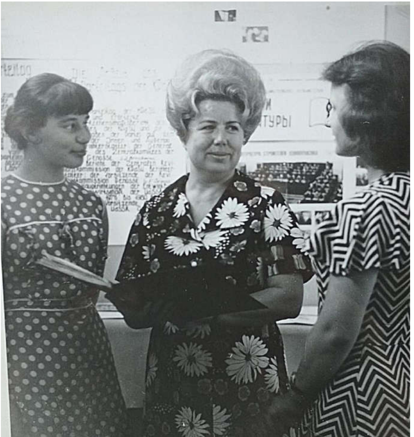
Фотография для доски почета. Изображаем сцену обсуждения реферата. Омавиат.