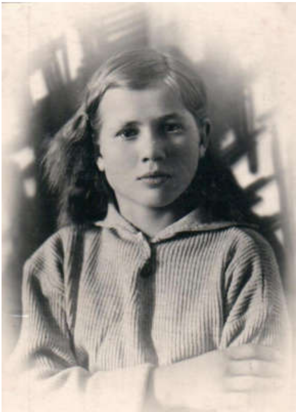
26 марта 1946г. Лида