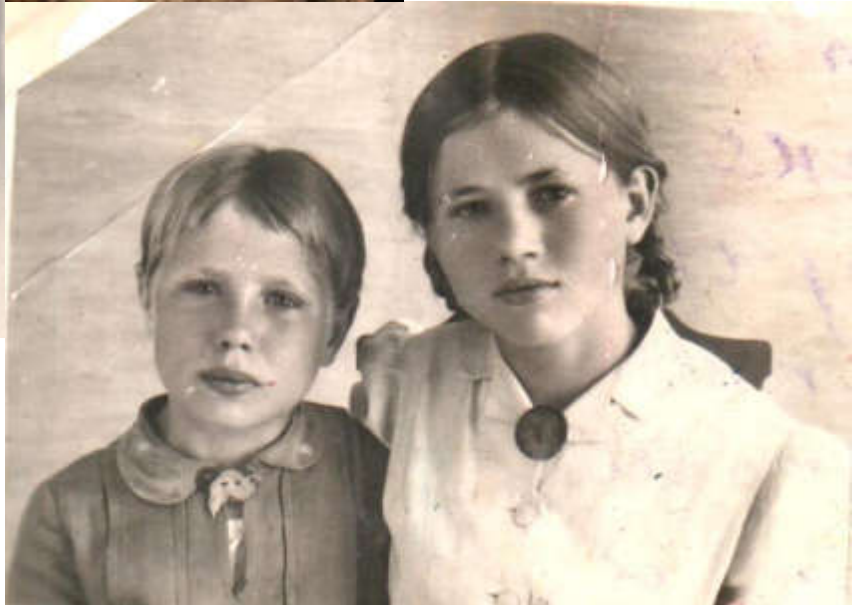
9 июня 1946г. первая встреча сестёр. 11 июня фотографировались.