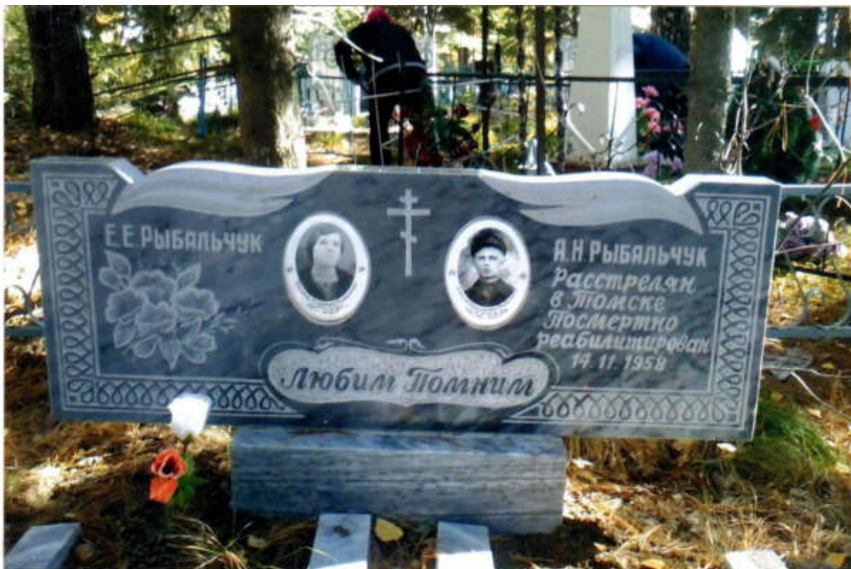
Памятник поставлен 2. 09. 2012г. Мне 79 лет.