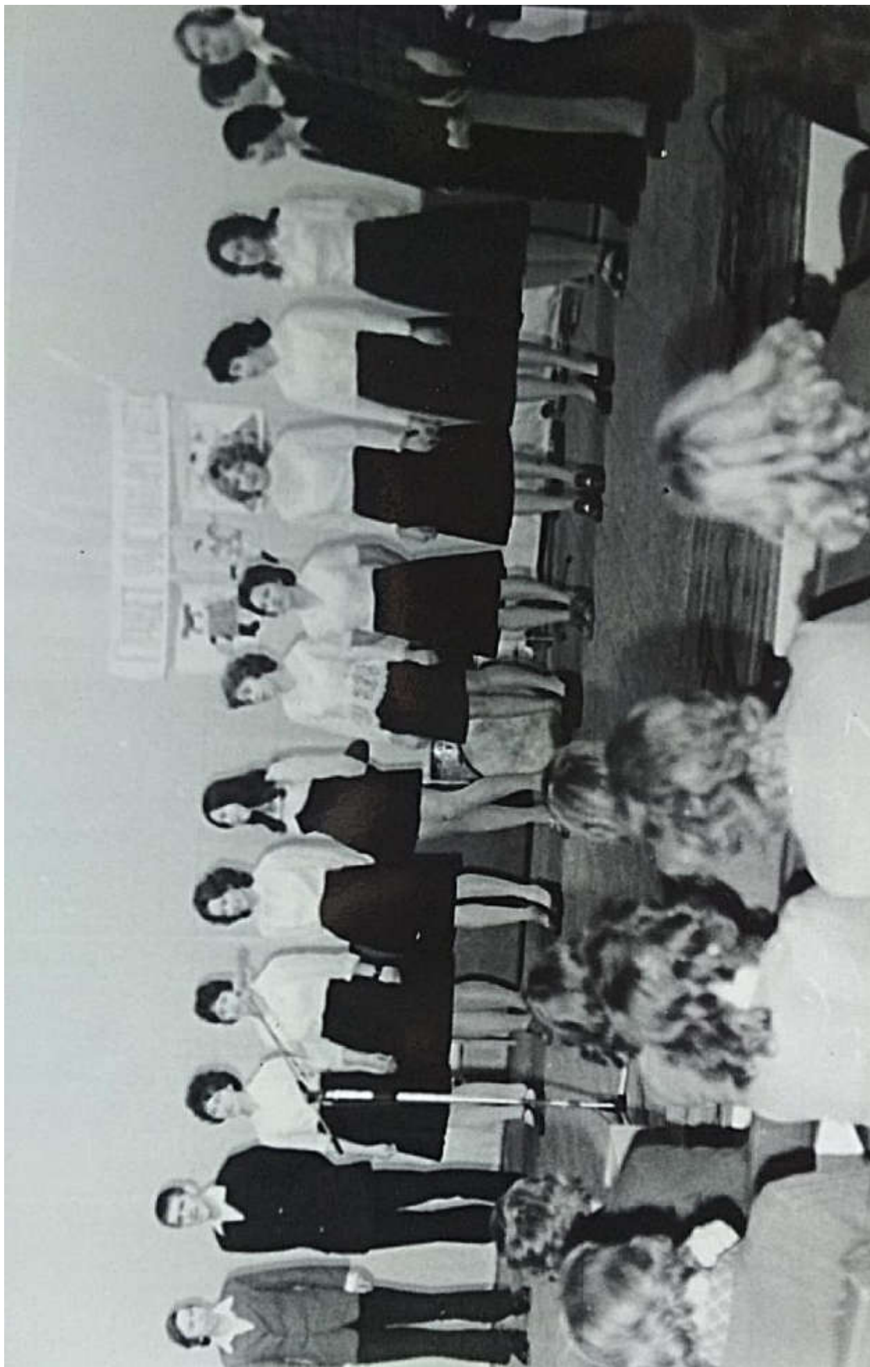
X-129. Самодетельный концерт на фестивале техникума. Победителями не стали, но посильное участие приняли.