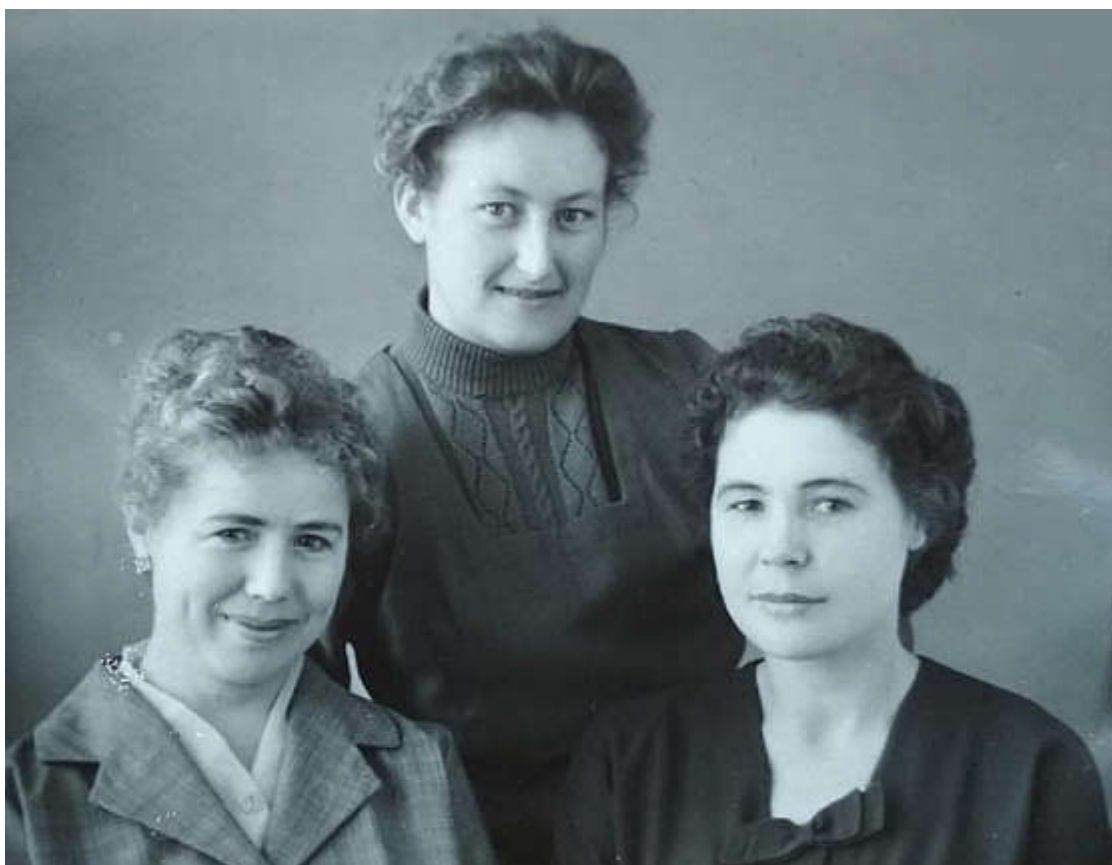
С этими молодыми коллегами мы жили вместе