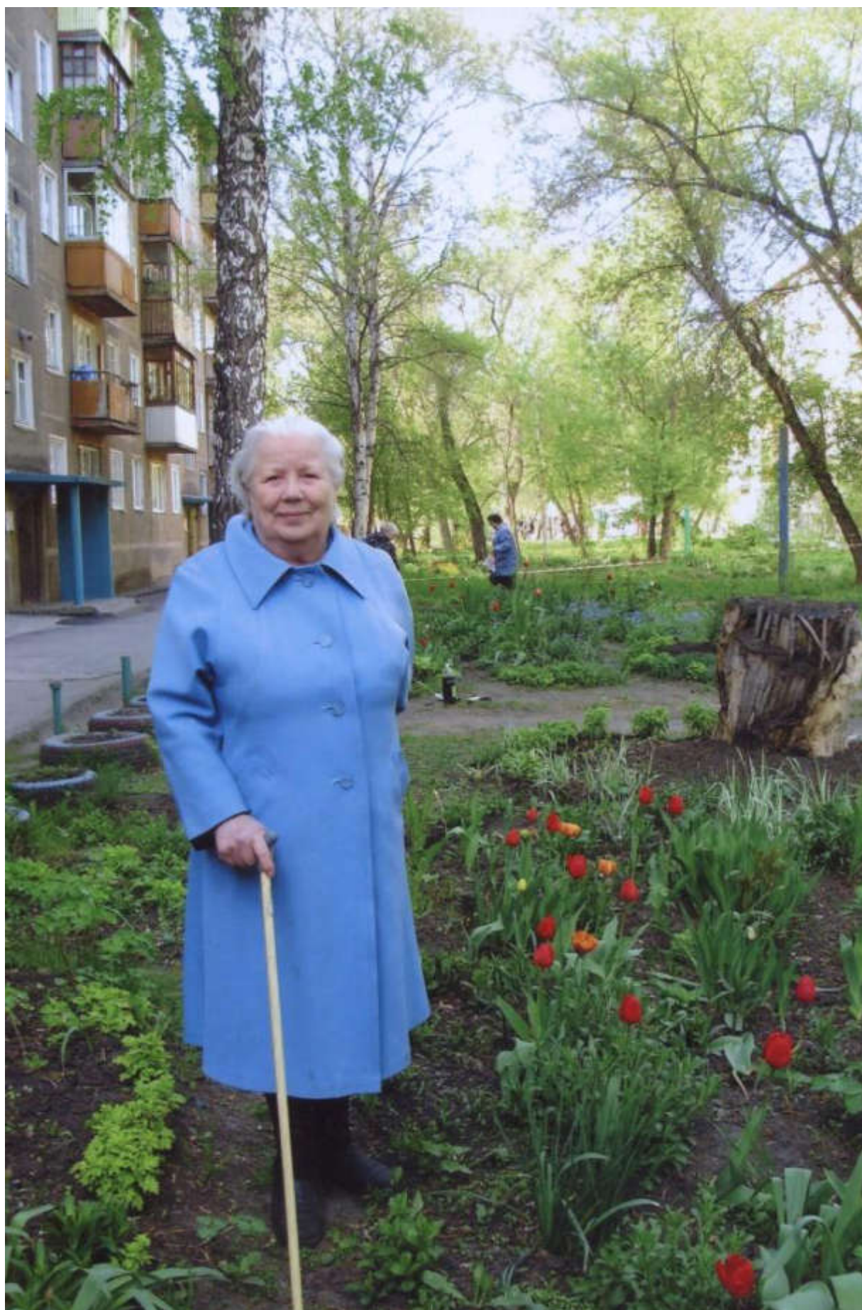
Возле дома своего