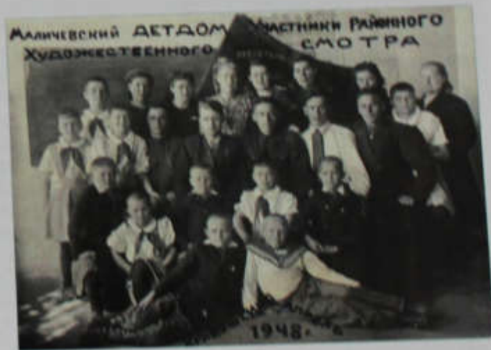
МАЛИЧЕВСКИЙ ДЕТДОМ МАСТНИКИ РАЙОННОГО ХУДОЖЕСТВЕННОГО СМОТРА