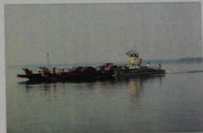
Паромная переправа Красный Яр – Нинольское