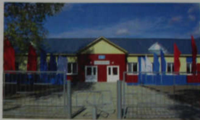
Красноярская средняя школа

С 2006 года в конкурсе «Лучшие учителя Том-