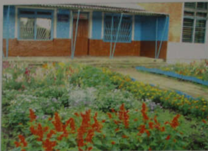
Петровская основная школа

В 1920 году был образован исполком Казырбакского сельского Совета рабочих, крестьянских и Красноармейских депутатов, который с принятием Конституции СССР 1936 года был переименован в сельский Совет депутатов трудящихся. С 1920 по 1952 год он относился к Кривошеинскому райисполкому. Село Петровка до 1952 года входило в состав Новониколаевского сельского Совета. В апреле 1952 года на базе Казырбакского сельского Совета на основании решения Кривошеинского райисполкома был организован Петровский сельский Совет. С декабря 1991 года исполком сельского Совета был ликвидирован, и решением № 98 от 31.05.1994 года была образована Петровская сельская администрация. В конце 2005 года был избран Совет Петровского сельского поселения. С 1 января 2006 года Петровская сельская администрация переименована в администрацию Петровского сельского поселения на основании Федерального закона № 131-ФЗ «Об общих принципах организации местного самоуправления в Российской Федерации» и Закона Томской области от 26.08.2004 № 1394 «О наделении статусом муниципального района, сельского поселения и установлении границ муниципальных образований на территории Кривошеинского района». Административным центром Петровского сельского поселения является село Петровка. На территории поселения проживает 917