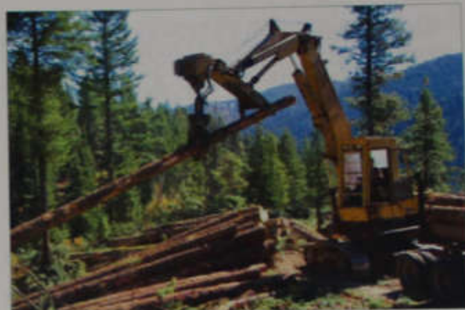
Лесозаготовка – основа экономики Красноярского сельского поселения

В 1934 году на территории Красного Яра был построен однорамный лесопильный завод. В 1936 году Красноярский механизированный лесопункт получает парогенераторные машины и тракторы ЧТЗ. В 1937 году организованы сплава-часток, лесхоз, ОРС. В 1939 году построены мехмастерская, автогараж, появились новые улицы Советская, Пушкина. Перед войной проложили от 19 км две лежневые дороги - одна на север, другая на юг. На их конечных пунктах выросли еще два рабочих поселка - Юг, Север. Во время Великой Отечественной войны вся работа мехпункта была подчинена основной задаче: обеспечить армию оружием, ствольной насадкой, пулеметами и поставить их на лыку. Кроме заготовки и вывоза деловой древесины, сибиряки занимались приготовлением скипидара как лекарственного препарата для фронта. В 1948 году Красноярский мехпункт был преобразован в леспромхоз. В 1949 году начал строиться посёлок Центральный, где был организован новый Ергайский леспромхоз. Шли годы. По причине истощения лесосырьевой базы для работ в летний период была создана вахта в Красноярском крае. С 1973 по 1983 год работали вахтовым методом. К концу 90-х годов резко был снижен объём производства древесины. В 1993 году леспромхоз был преобразован в акционерное общество открытого типа «Ергайлес». В 2000 году оно перестало функционировать. 10 октября 2004 года открыто лесозаготовительное предприятие «СибЛесТрейд».