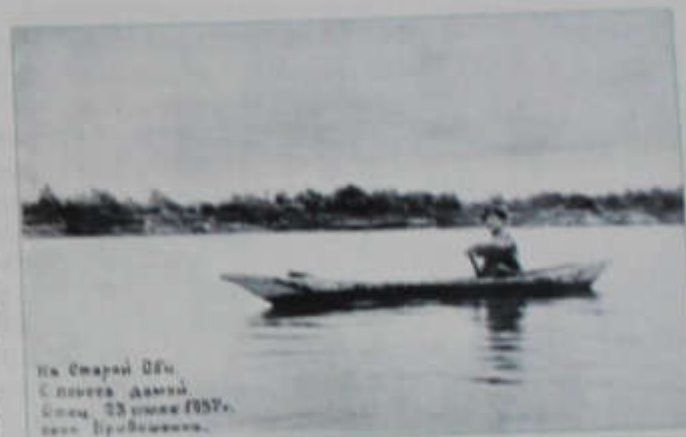
На Старой Оби. Словца дамки. Спец. 23 июля 1957. с.с. Кривошеино.

1896 год. Появился поселок Вознесенка (Южара) и Ивановка Белостокского сельского Совета, Ново - Кривошеинские и Междуреченские хутора.