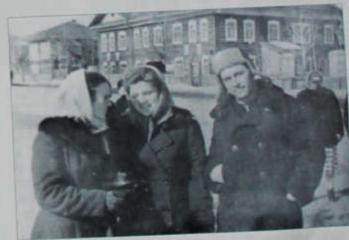
Улица им. Ленина в Кривошеино, 1962 год