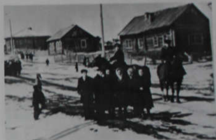
ул. Октябрьская, 1934 год