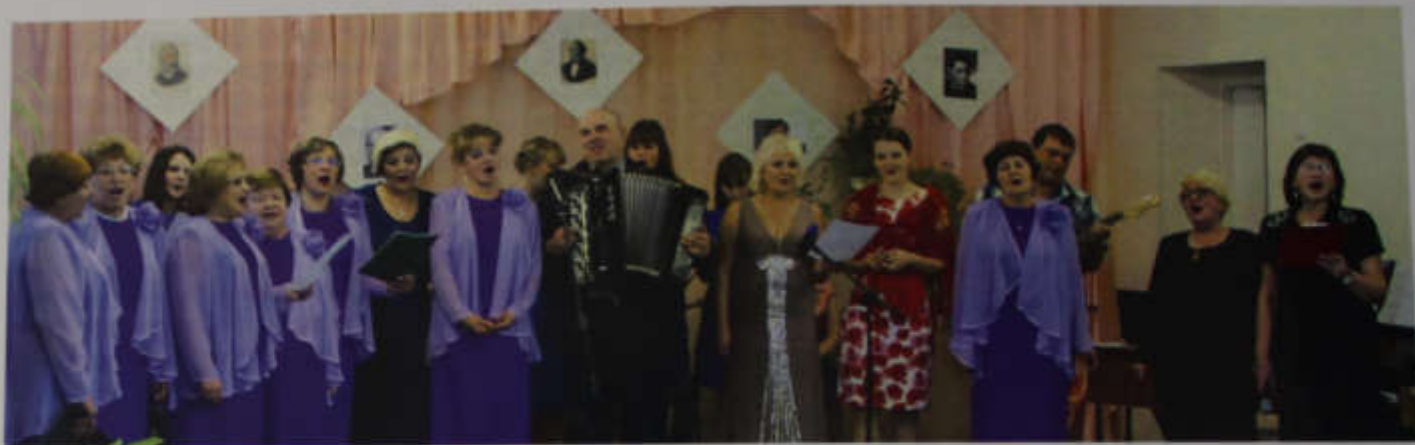
Ансамбль «Гармония», с. Володино