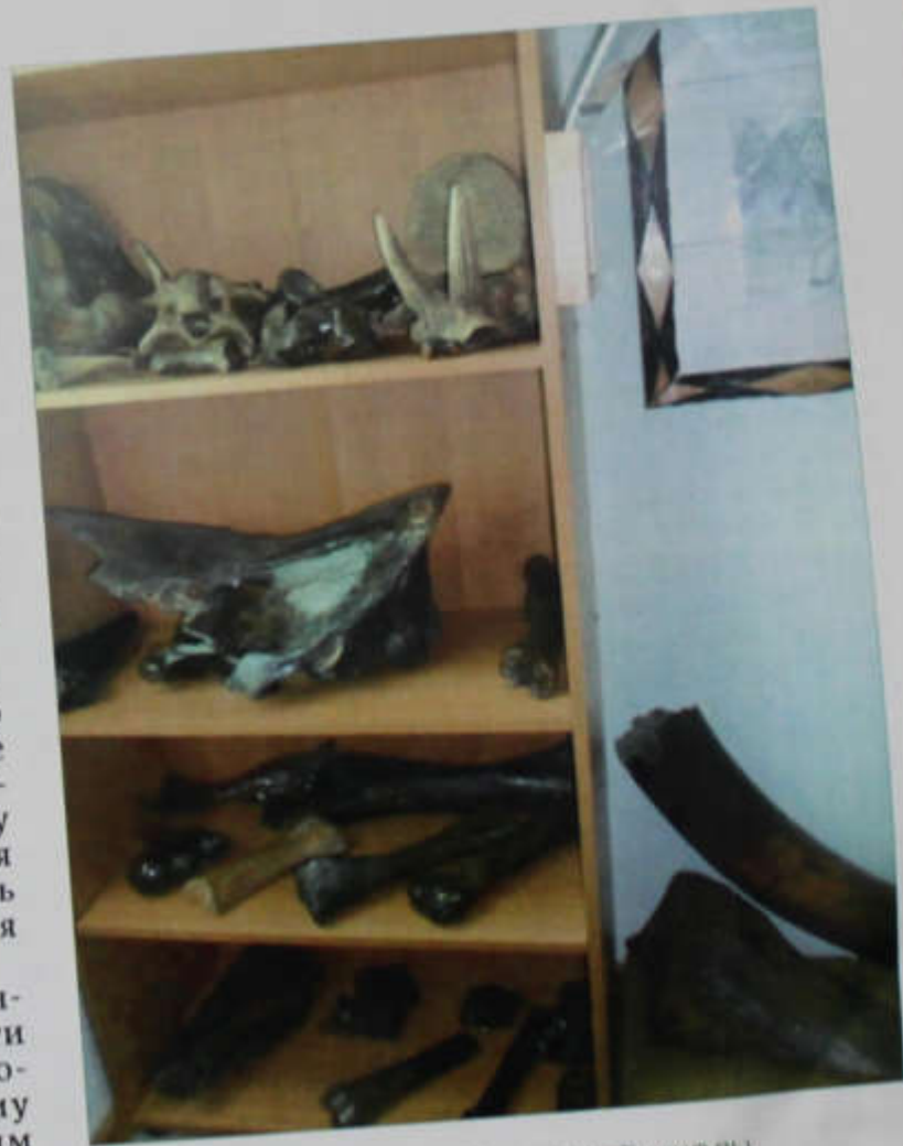
Экспонаты музея Белобугорской школы

Следы наших далеких предшественников хранит земля, и увидеть эти следы поможет археология. Археологу, историку, восстанавливающему картины прошлого по вещественным источникам, земля открывает свои тайны.