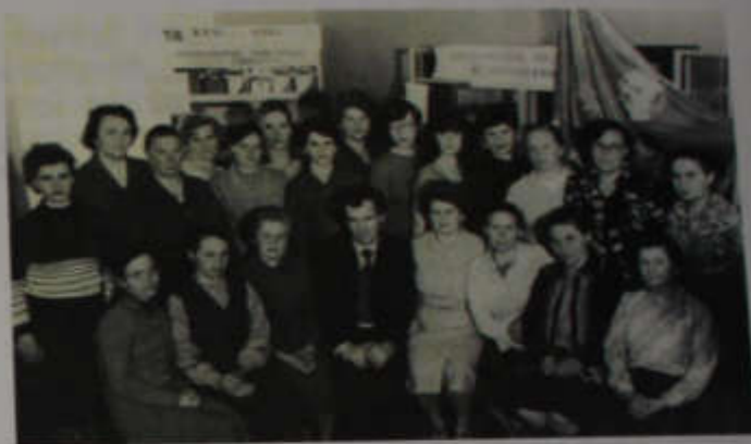
Награждение коллектива переходящим Красным знаменем по итогам соревнования библиотечных систем области в 1981 году

В шести библиотеках района в настоящее время работают центры общественного доступа для населения. В центральной библио-