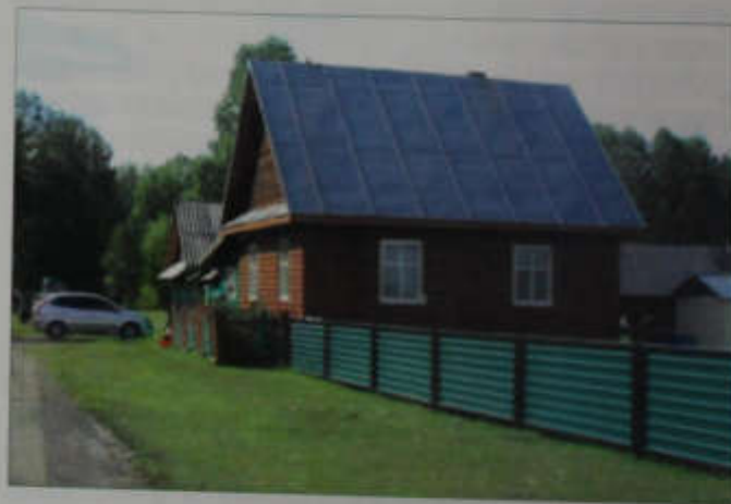
Усадьба В.Н. Полубятно