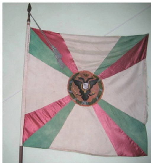
Копия знамени Томского пехотного полка, изготовленная по указу Николая II в 1912 г. Хранится в Алтайском государственном краеведческом музее.

Напротив Журжи на Дунае находился остров Макона. С него турки вели наблюдение за нашими полками и частенько перестреливались с томскими егерями. 28 октября генерал Соймонов приказал артиллерии отряда выкурить турок с острова. Макона был обстрелян, турки скрылись. Однако на следующий день они появились как ни в чём не бывало, и явно показывая, что огонь наших пушек был малорезультативен. На военном совете было решено послать на остров небольшую боевую группу для уничтожения турецкого гарнизона. Добровольцами на это опасное дело вызвались 80 томских егерей. Рано