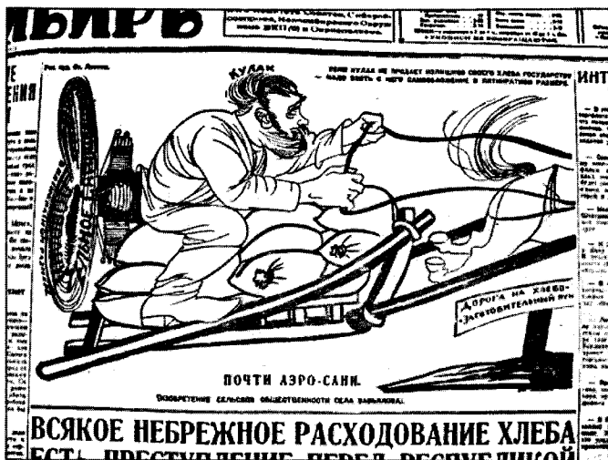
Советская Сибирь. 1929. 24 марта

недовыполнения годового плана по состоянию на 20 марта. Непосредственно в деревню была направлена армия уполномоченных, задачами которых было навязывание крестьянам поселенных планов и их подворная разверстка.