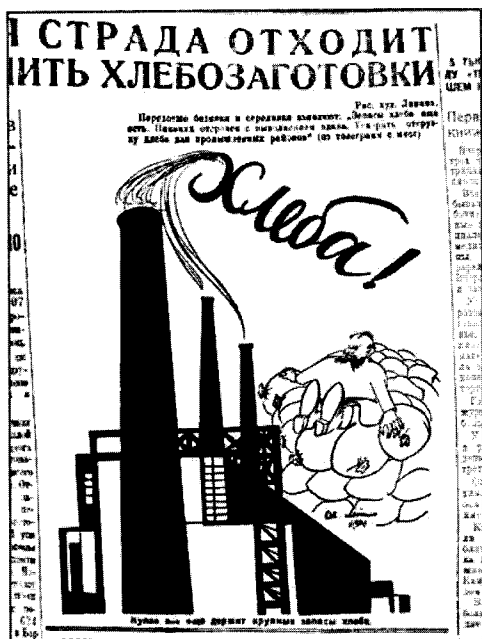
Советская Сибирь. 1929. 28 мая

полнения даже с применением чрезвычайных мер представлялось абсолютно невозможным. В то же время потребность в зерне возросла. Часть накопленных в марте — апреле государственных резервов была использована для посева погибших на Украине озимых. Крайне напряженным оставалось продовольственное положение в городах и потребляющих районах. Ситуацию необходимо было стабилизировать, так как неудовлетворенный спрос на хлеб мог осложнить начало предстоящей заготовительной кампании и отрицательно сказаться на ее результатах в целом. В связи с этим СТО 7 мая принял обязательное минимальное задание по заготовкам продовольственных культур на май, июнь и июль 1929 г. в размере 55 млн пудов 206 . Срок окончания кампании, таким образом, переносился на месяц.