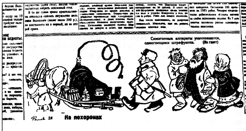
Советская Сибирь. 1928. 28 янв.

Репрессии следовало обрушить и на самогонщиков. 27 декабря 1927 г. ЦИК и СНК СССР приняли постановление «О мерах усиления борьбы с самогонварением», в котором предложили ЦИК союзных республик в двухнедельный срок внести в уголовные кодексы в число уголовно-наказуемых деяний самогонварение без цели сбыта, а также хранение самогона и аппаратов без цели сбыта 63 . С 1926 г. преследовалась только продажа самогона. Соответствующее решение ВЦИК было принято в тот же день. Наказание за тайное винокурение увеличилось с двух недель принудительных работ или штрафа в 25 руб. до месяца принудительных работ или штрафа в 100 руб. 64