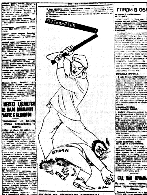
Советская Сибирь. 1929. 15 июня

и т. п., командирова на места происшествий представителей окружных организаций». Кроме того, бюро крайкома признало «совершенно недопустимым все еще наблюдающиеся случаи ограничения базарной торговли хлебом» и предложило окружкомам «немедленно отменять такие ограничения» 218 .