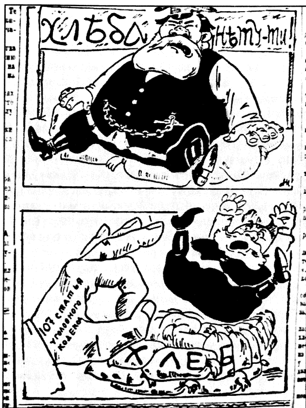
Советская Сибирь. 1928. 29 янв.

8. Организацию нажима на хлебозаготовительном фронте считать ударной задачей партийных и советских организаций, а самый нажим продолжать вплоть до полного выполнения плана заготовок».