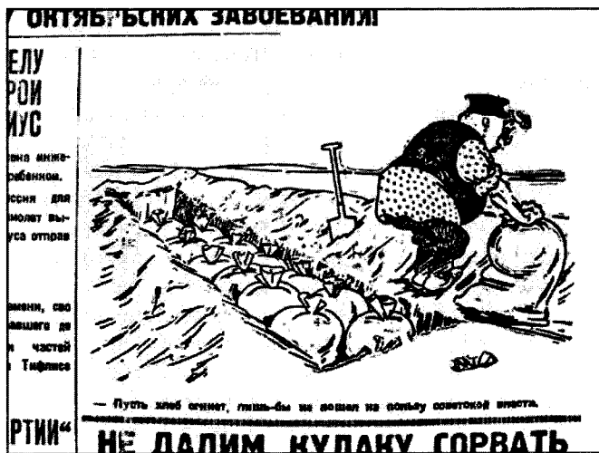
Сельская правда. 1929. 29 авг.

ре, лишенных прав, обложенных индивидуально, с тем чтобы была применена максимально возможная мера репрессий — конфискация имущества и высылка, [в] отдельных случаях — расстрел. Процессы должны быть обеспечены широкой массовой работой среди бедноты [и] середняков, [с] тем чтобы [с] их стороны была безусловная поддержка этих репрессий. Показательные процессы должны широко, умело освещаться [в] печати, создавая общественное мнение [о] неизбежности поражения кулака» 108 .