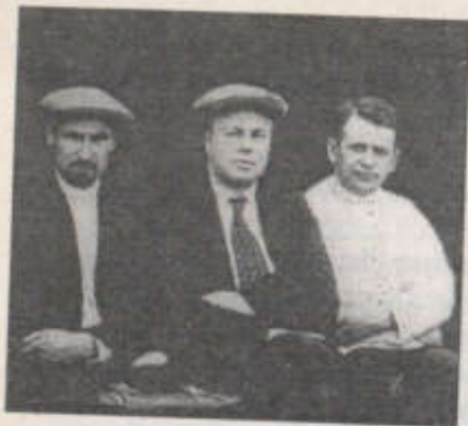
Р.И. Эйхе, С.И. Сырцов, В.Н. Кузнецов. Июнь 1929 г.

Таким образом, вся «революционная законность», созданная энпом, безжалостно разрушалась под натиском тех требований, которые Сталин решил предъявить крестьянству.