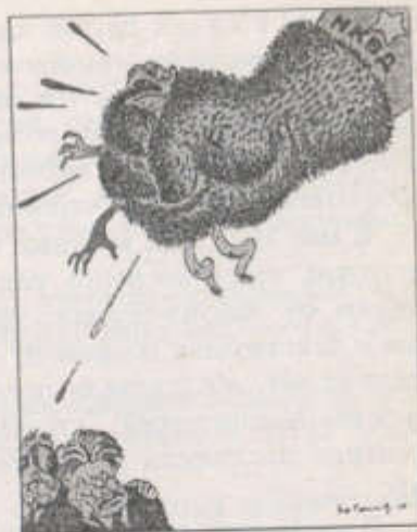
«Ежовы руки». Рис. Б. Ефимова, 1937 г.

Масла в огонь подливала печать. Газеты ежедневно публиковали грязные инсинуации и откровенные доносы, призывали и требовали «разоблачать правооппортунистическую прак-