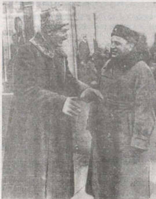
Р.И. Эйхе и В.М. Курский на демонстрации 7 ноября 1936 г., г. Новосибирск

В 50-е годы, в ходе реабилитации жертв террора, стали известны некоторые дополнительные сведения о последствиях поездки Кагановича в 1936 году. А.И. Успенский, бывший заместитель начальника УНКВД по Западно-Сибирскому краю, показывал, что замначальника ДТО УНКВД Г.М. Вяткин по его заданию сфальсифицировал дело об антисоветской органи-