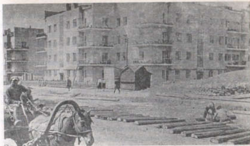
Новосибирск в 30-е годы.

Так после Шахтинского процесса 1928 года в Сибири оказалась большая группа донбасских «вредителей», избежавших