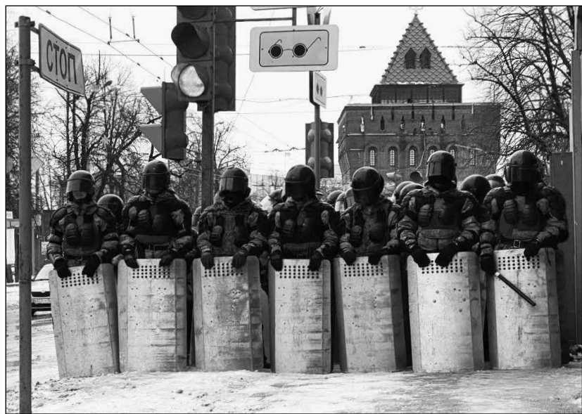
➤ Окончание. Начало на с. 1

Репрессии в отношении Алексея Навального — лишь наиболее яркий эпизод самой мощной за последние десятилетия кампании давления на гражданское общество России, начавшейся в конце 2020 года с внесения поправок в законодательство, ограничивающих практически все конституционные права и свободы граждан.