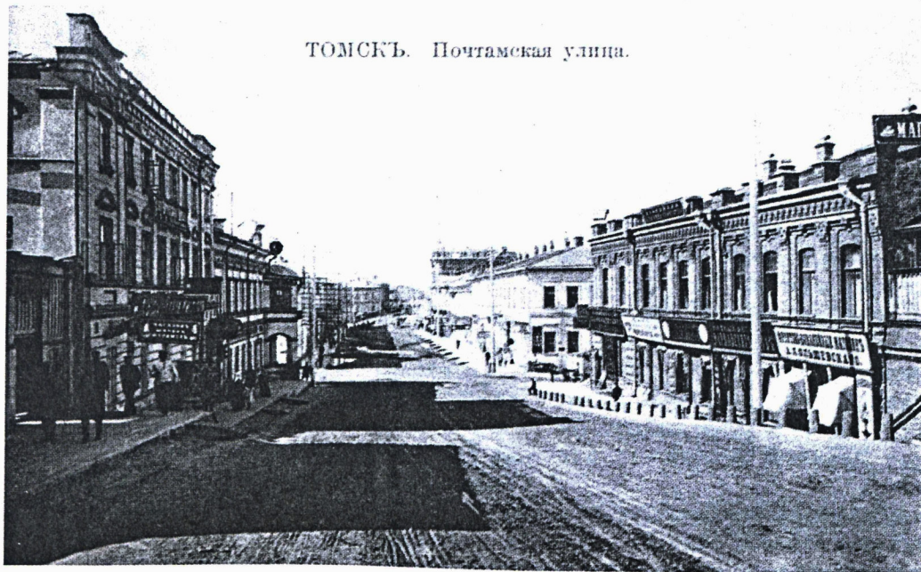
ТОМСКЪ. Почтамская улица.