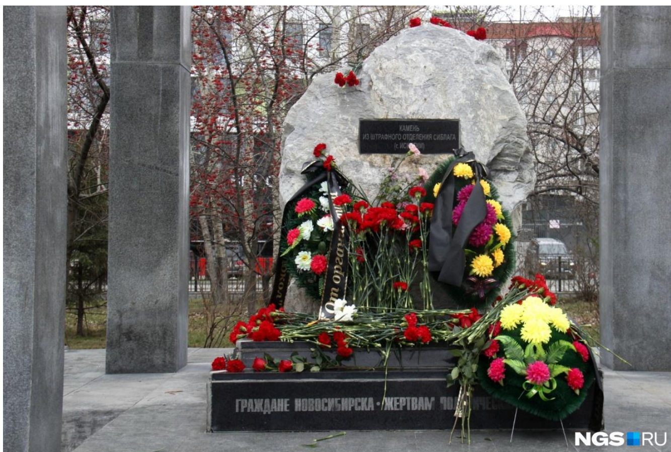
Памятник жертвам политических репрессий в Нарымском сквере, на заднем фоне видна высотка, выросшая на месте тюрьмы