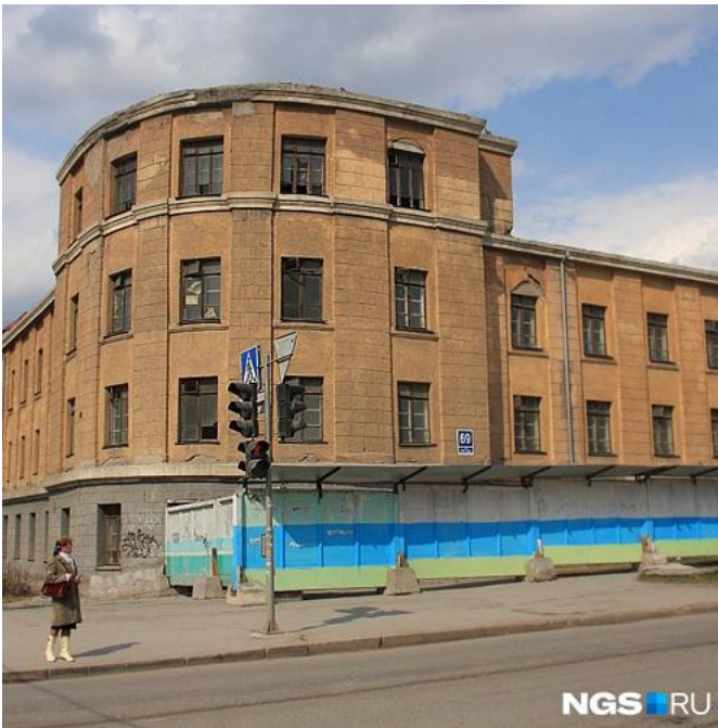
Здание тюрьмы на улице 1905 года до 2013 года