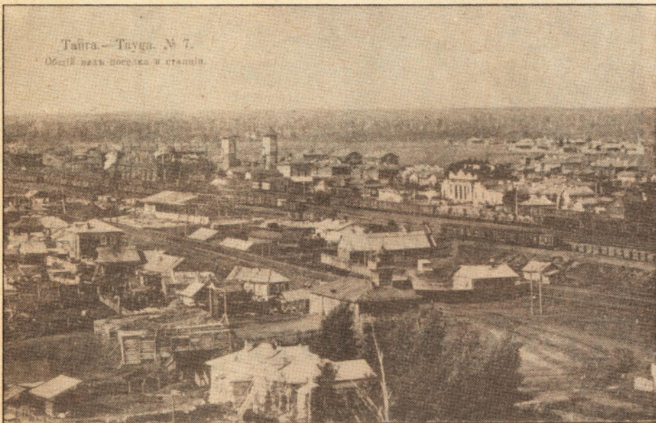
Тайга - Тайга. № 7. Общий вид поселка и станции.

соруба: в то время женщины были очень скромны и не показывались постороннему человеку. Муж и