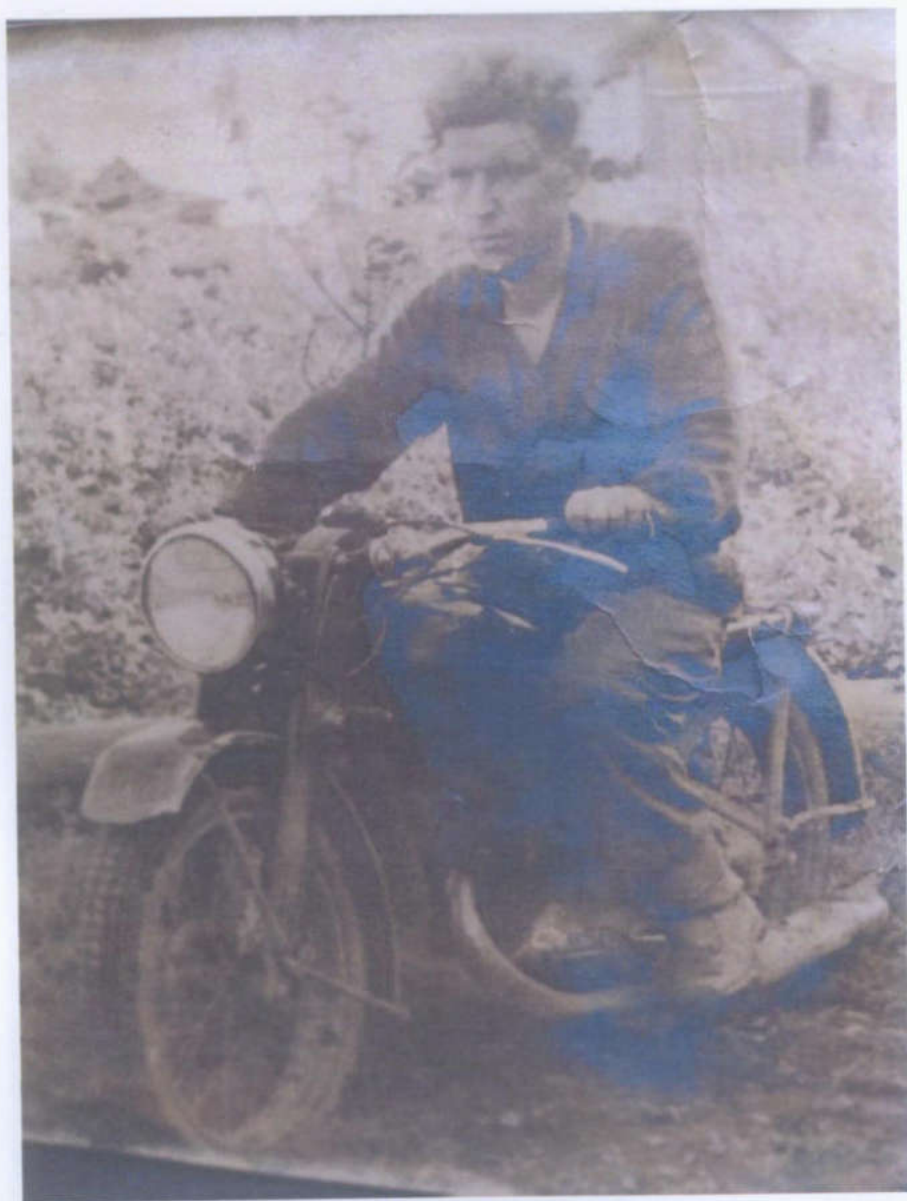
Отец за рулём мотоцикла "ИЖ-350". Лето 1948 года.