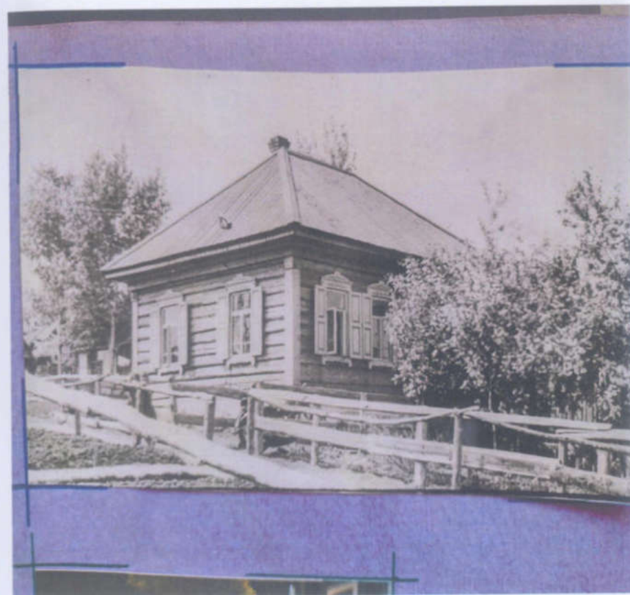
В городе Осинники, на улице Елбань в 1951 года был построен новый дом.