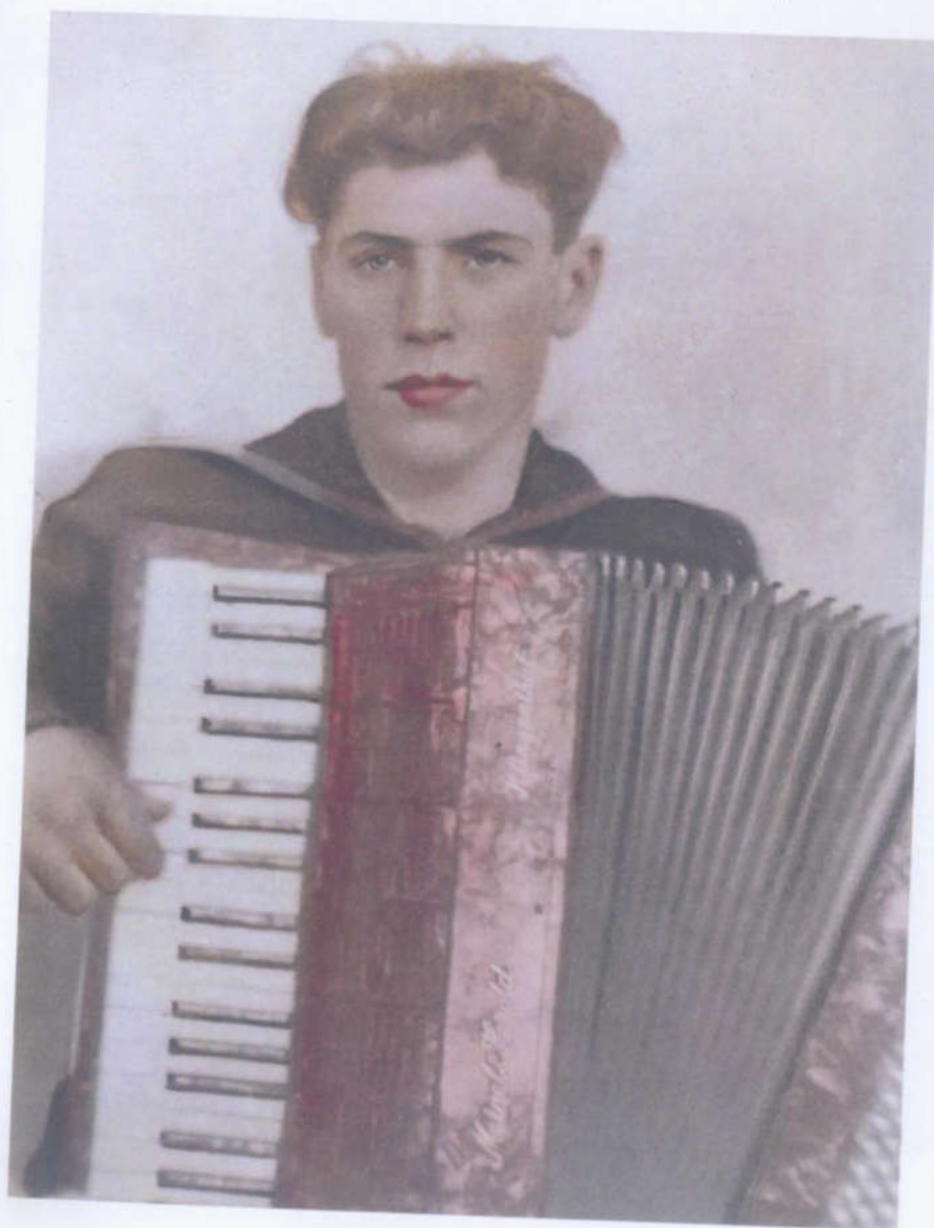
Первый аккордеон. Декабрь 1946 года.