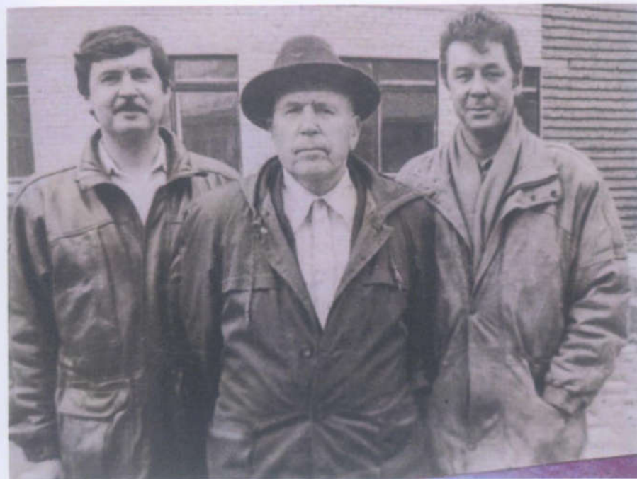
25.04.1993 года мы в городе Томске, после выборов.