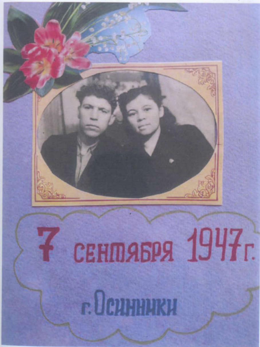
В день свадьбы.