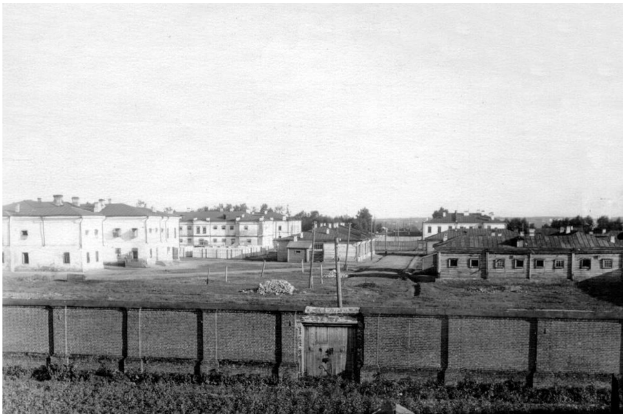
Томская тюрьма №3 тюремного отдела УНКВД по НСО ЗСК СССР на Каштачной горе в городе Томске.