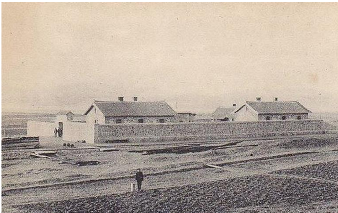
Пункт Заамурской пограничной стражи

Служил в Манчжурии, в Заамурской железнодорожной бригаде Пограничной стражи Заамурского пограничного железнодорожного полка, которая должна была контролировать эксплуатацию Китайско-Восточной железной дороги (КВЖД).