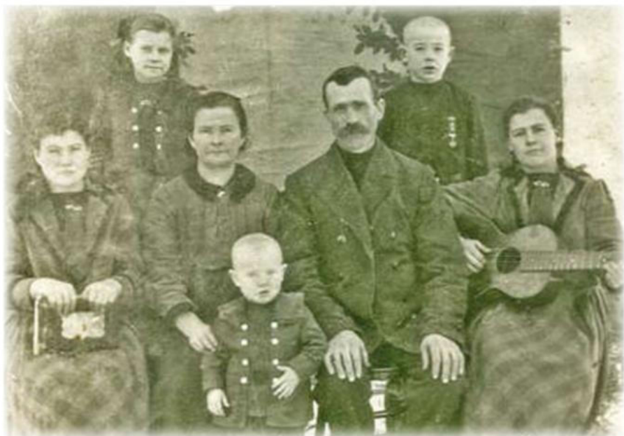
Семья Рани до высылки. 1928 год. Алтай.

возле Айполово, где жили народы Севера, старожилы. Потом Волково-16 участок. «Путь Севера»-17 участок. Там высадили наших земляков - Гембух, Винс и ещё несколько семей. Выше Огнев Яр - 18 участок, Ершовка-19 участок, Медведка-20 участок, Могутаево- старожилы, Андриюшкино- старожилы, Увал- старожилы, Малиновка-21 участок, Майск- 22 участок, Каменный-23 участок, наконец Елизаровка - старожилы. На другой стороне Васюгана пароход остановился. Наш черёд выгружаться, нас встречали мужчины, матери, сёстры и братья, которые были вывезены раньше. От берега Васюгана-реки до будущего посёлка семь километров шла узкая конная дорога, прорубленная по густому лесу, и мы отправились по ней, комара страсть, невоготу. Мне пошёл тогда девятый год, мы, малыши, устали. Старшие нас посадили