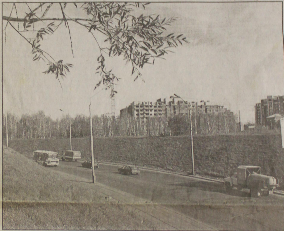
• Въезд на Каштачную гору.

Однако жестокие законы Гражданской войны просто блекнут по сравнению с той машинной уничтожением, которая функционировала с 1920 по 1938 год. Огромный кусок Томской земли, ограниченный улицей Ильмера, проспектом Мира и Страшным (или Страстным - от "страсть", что в переводе со славянского означает "страдание") равом, идущим вдоль юго-восточного склона Каштачной горы, превращается в настоящие гекатомбы - места массовых беспорядочных захоронений жертв сталинского режима... Люди содержались в исправительно-трудовом лагере (ИТЛ-2) - бывшем пересыльном замке (с 1871 года), нынешнем СИЗО на улице Пушкина. Репрессированных выгоняли прямо в Страшный ров, где и убивали. По разнарядкам... Кстати, в этом пересыльном замке (до революции в нем была еще Спасская церковь) содержался в 1912 году и Иосиф Сталин (Джугашвили), а также Сергей Киров (Востриков). Время тогда было мир-