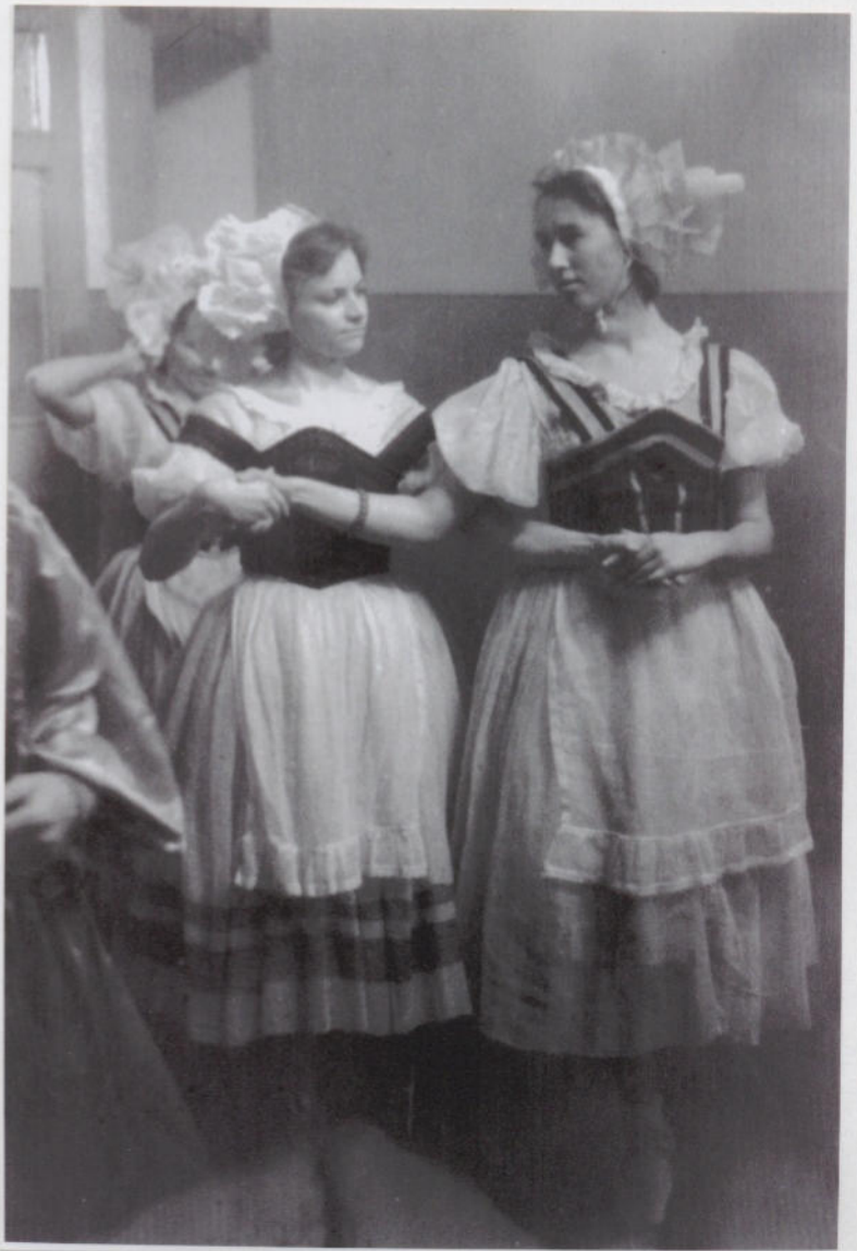
Балет «Тщетная предосторожность» фото в перерыве.