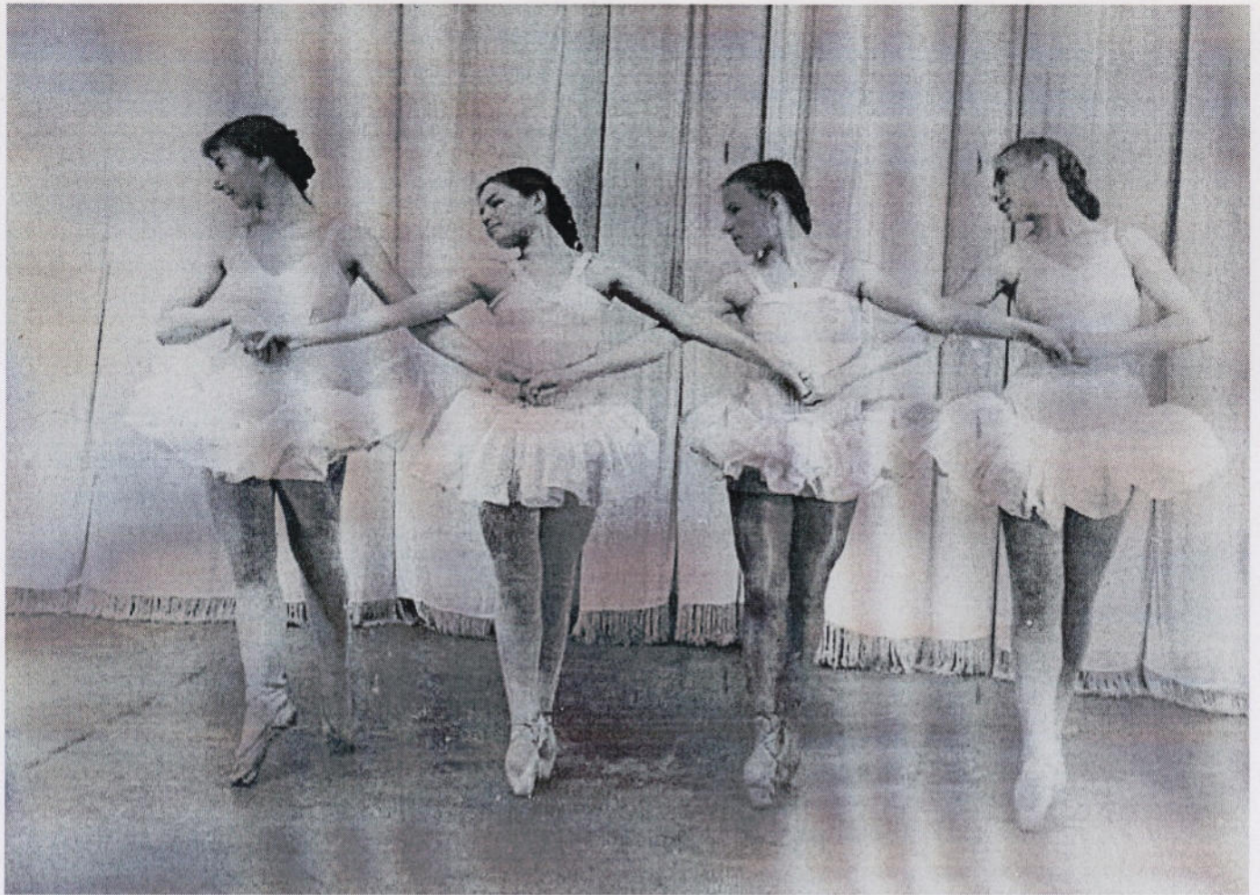
Танец „Маленьких лебедьей“ ТВ Томск