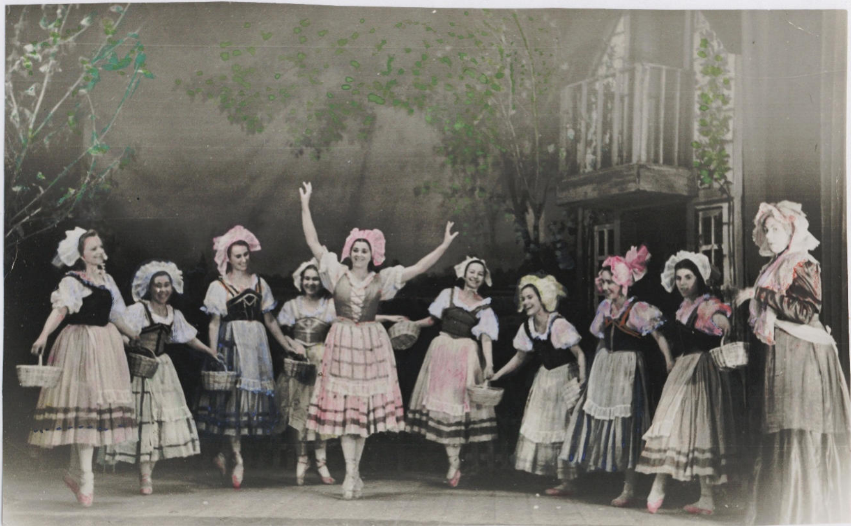
„Танец с корзинками!“ Веселая пауза!