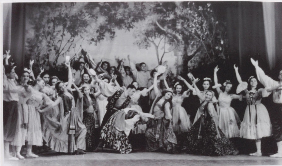
Финал балета „Цветная предосторожность“. Цыганский танец.