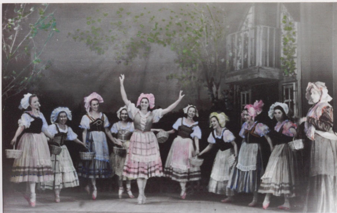
Фото после спектакля. Танец с корзинками. „Цветная предосторожность“ на сцене Дворца труда.