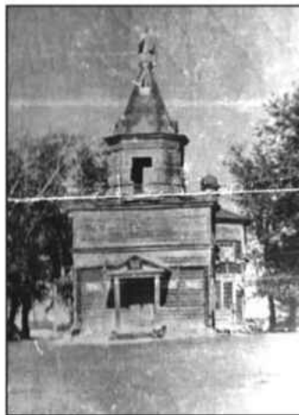
Николаевская церковь с. Медведевского, фото до 1963 г.