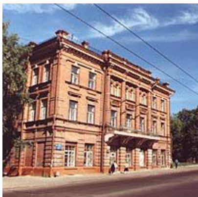
Фото 5. Здания в Томске, где орудовали нелюди из НКВД...