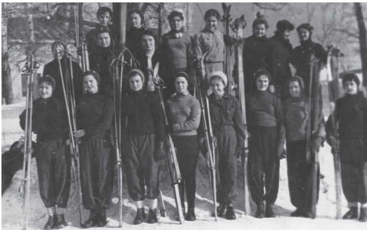
Участники лыжных соревнований 1959 г.

В моей школьной характеристике говорилось: «Сданы все нормы ГТО». В декабре 1959 года состоялись соревнования по