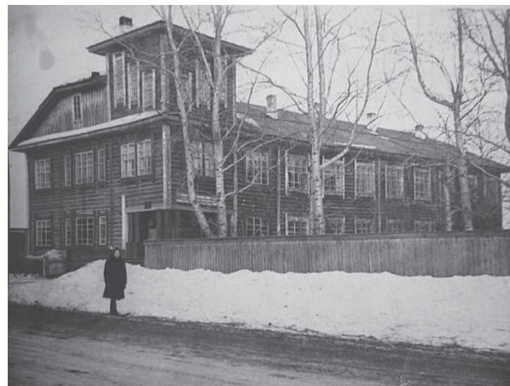
В этом здании размещалась Колпашевская комендатура ОГПУ