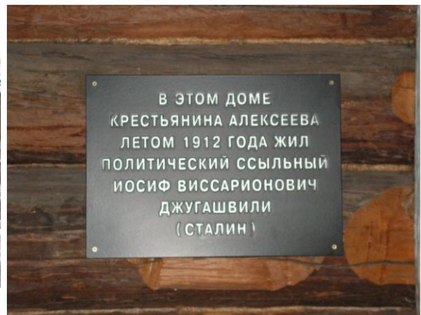
Здание Нарымской каталажки, перенесенное на территорию музея.