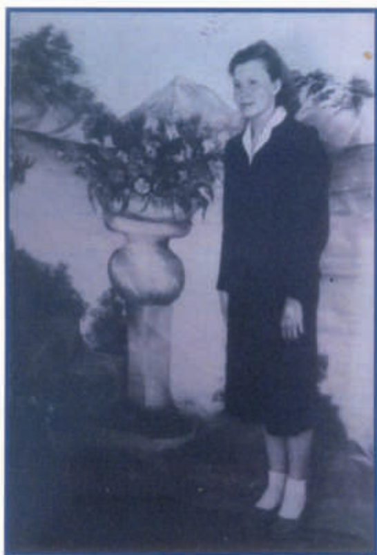
Лига Яновна 1964 год