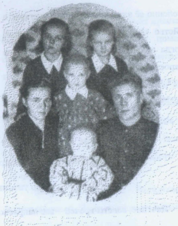
Семья Кормилицыных, 1956 г.

К великому сожалению, неизбежен час, когда человек покидает земной мир. Угасла и мамина звезда. Но для нас она остается звездочкой ясной, которая в трудную минуту освещает нам дорогу жизни и помогает принять правильное решение. Светлая тебе память, милая мама, для нас по-прежнему немеркнущая путеводная звезда.