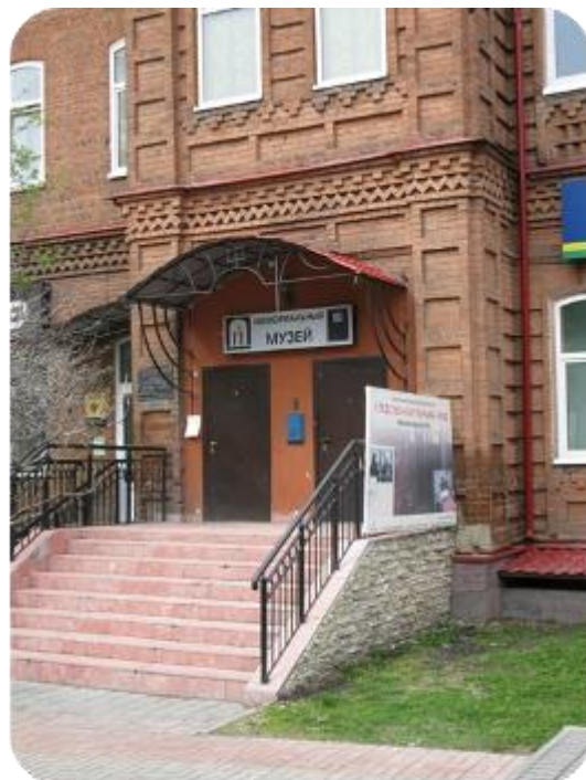
Мемориальный музей "Следственная тюрьма НКВД". Город Томск.