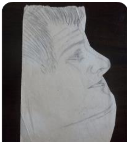
портрет отца, нарисованный рукой мамы