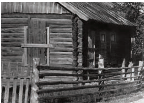
Здание бывшей комендатуры

Интересные здесь люди, открытые, словоохотливые, закаленные. Старики, дети ссыльных