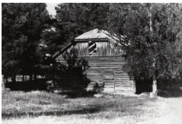
Все, что осталось от детского дома

крестьян, живущие на Васюгане, словно выросшие в землю кряжистые кедры. Кулачищи – что гири, такой справится с любым зверем. По привычке в деревне ходят босиком, не обращая внимания на гудящий рой гнуса. Привыкли – говорят старики. И никуда отсюда не собираются уезжать. До сих пор на душе тяжелым клеймом лежит позорное звание «спецпереселенец». Сначала, когда это клеймо было снято, держал давнишний страх перед возвращением на землю отцов. Сейчас держит сила привычки. Неприветливое для их родителей Васюганье стало для этих людей второй родиной.