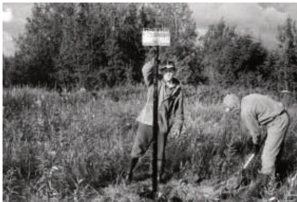
Здесь жили омские крестьяне