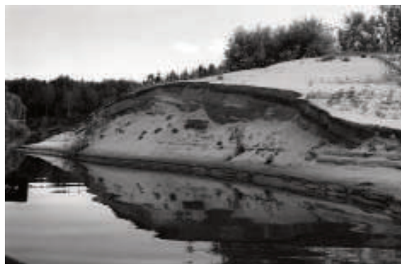
Берега у Чижапки песчаные

Река делает такие замысловатые повороты, что просто диву даешься. Захочешь придумать – нарочно не придумаешь – такие вензеля. Наш