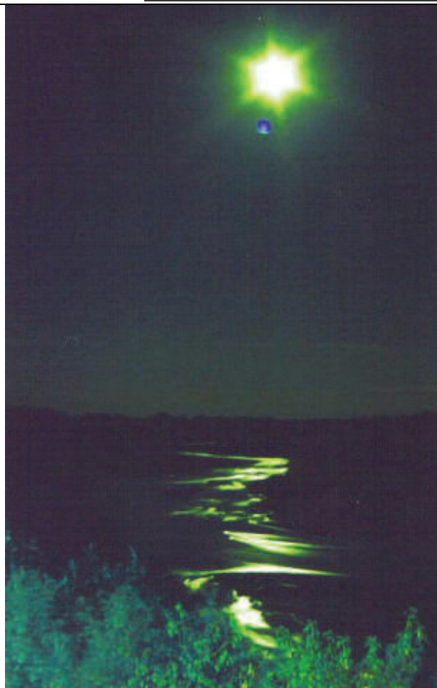
Город Оренбург, река Урал, речной поворот от старицы у роши, под Форштадтом.