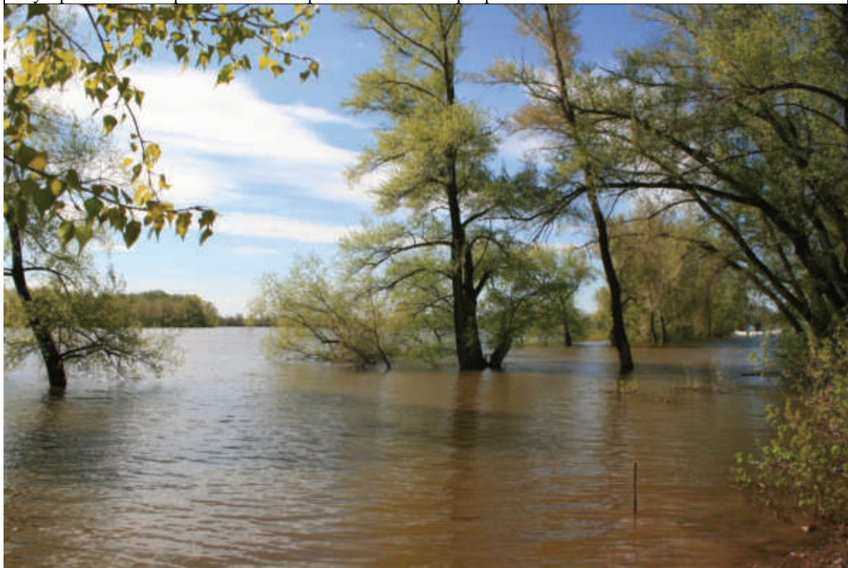
Оренбург. Зауральная роща. Большая вода. Май 2017 г.

По просьбе Оренбургского Движения Мемориал, согласно письма предоставленного Правительством Оренбургской области, в 2006 году, списочные материалы в объеме порядка 21000 (из более 26000) фамилий Оренбуржцев подвергшихся незаконным репрессиям и впоследствии реабилитированных переданы из архива УФСБ в музей истории города Оренбурга для составления печатных материалов и обеспечения открытого доступа граждан. Так же, музеем истории города Оренбурга, начиная с 1996 года Оренбургская общественность, передала иные имеющиеся материалы по теме репрессий, в том числе принятый и утвержденный в 2014 году эскизный проект обустройства Мемориала памяти жертв политических репрессий.