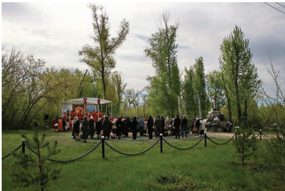
В год 80 летия начала событий 1937 года названных “большим террором”. Зайральная роща. Литургия по невинно убиенным. 6 мая 2017г. Служба организована и проведена митрополитом Оренбургским и Саракташским владыкой Вениамином.