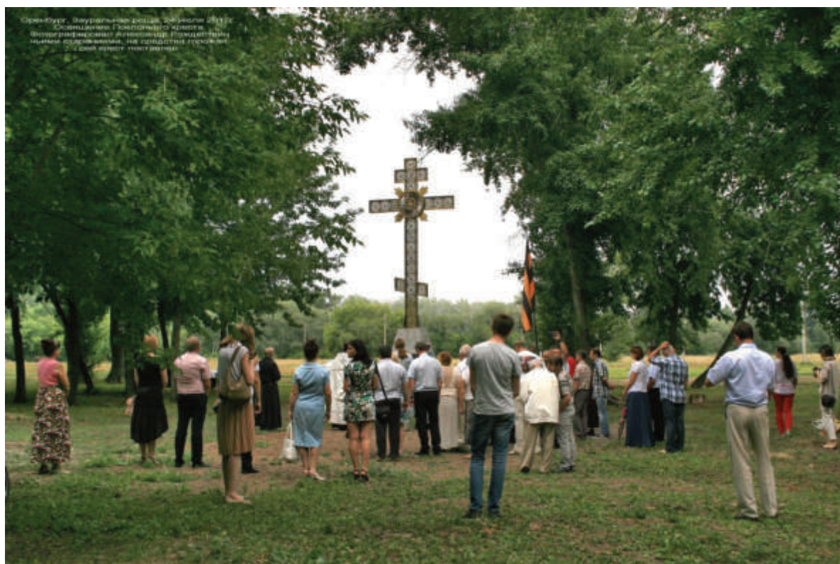
Освящение и открытие (24 июля 2017 г.) поклонного креста памяти разрушенной церкви великомученика и целителя Пантелеймона в Зайральной роще города Оренбурга.