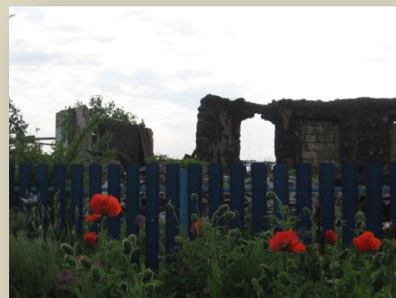
Село Никишино было почти целиком уничтожено в ходе боев за Дебальцево в январе-феврале 2015 года

По итогам поездок ХПГ и ПЦМ должны совместно подготовить доклад, который будет представлен осенью с.г. в Варшаве на осенней сессии БДИПЧ.