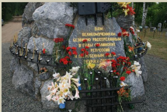
Памятник жертвам политических репрессий в Оренбуржье

М есто массовых захоронений 1920-1950-х годов в Зауральной роще города Оренбурга открыто для свободного доступа в 1988 году. С 1991 года является памятником истории и культуры регионального значения. Внесено в государственный реестр памятников истории и культуры народов Российской Федерации распоряжением Министерства культуры России в 2015 году.