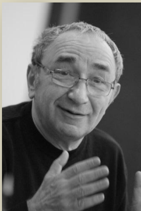
А.Б.Рогинский, председатель Правления Международного Мемориала

Соответствующее письмо было направлено Р.Латыповым в адрес Председателя Рабочей группы М.А.Федотова.