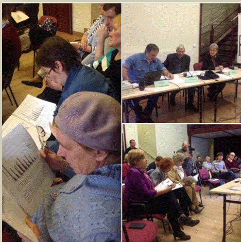
Презентация доклада в Московском Мемориале

В июне Правозащитный центр «Мемориал» представил вниманию широкой общественности Доклад «Контртеррор на Северном Кавказе: Взгляд правозащитников. 2014 г. — первая половина 2016 г.».