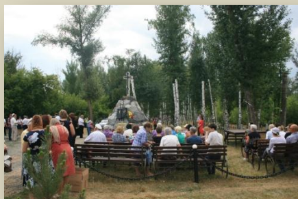
Место массовых захоронений 1920-1950-х годов в Зауральной роще Оренбурга

Присутствующие почтили память невинно убиенных минутой молчания, зажгли свечи и возложили цветы к подножию памятника, после чего прошла духовная панихида. На мероприятии присутствовали журналисты местных газет и телевизионных каналов.