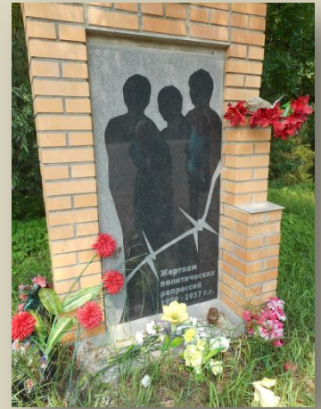
Памятник жертвам политических репрессий

Встреча прошла в атмосфере доброжелательности, понимании этого вопроса.