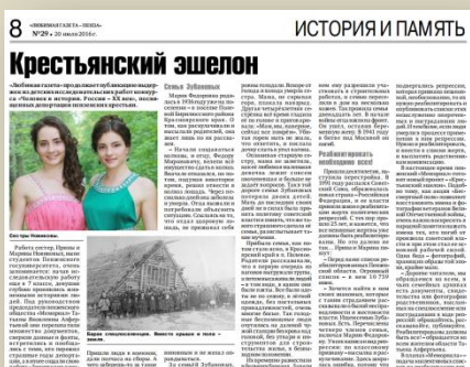
Публикация в "Любимой газете"