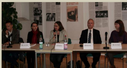
Дискуссия в Берлине

Десенс, отец которого после освобождения немедленно убежал в Западную Германию, рассказывал о том, что в 60-е и 70-е годы о судьбах бывших узников ГУЛАГа в ФРГ предпочитали не говорить – на эту тему чуть ли не было наложено табу, и мало кто об этом знал.