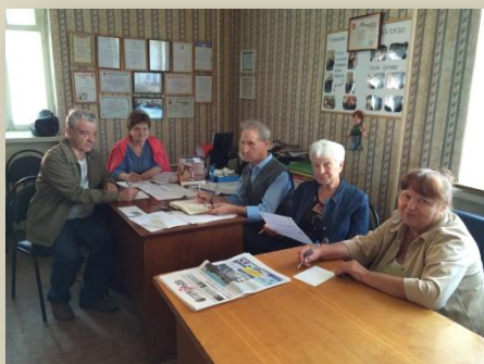
Правление Владимирского Мемориала