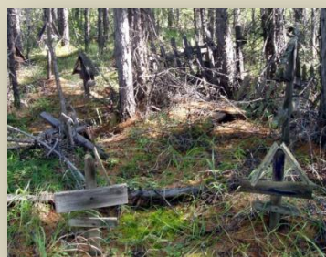
Эльген, детское кладбище

Самым же оригинальным экспонатом, пополнившим музей «Память Колымы», была доска, на которой углём сделана надпись на иностранном языке: «Allons enfants de la Patrie!». Нашли мы её в одном из лагерных строений оловянного рудника-лагеря «Светлый». В