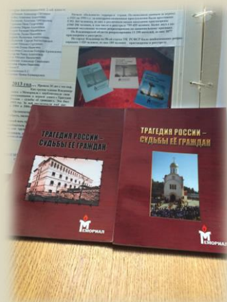
Пятый сборник воспоминаний жертв политических репрессий «Трагедия России-судьбы ее граждан»