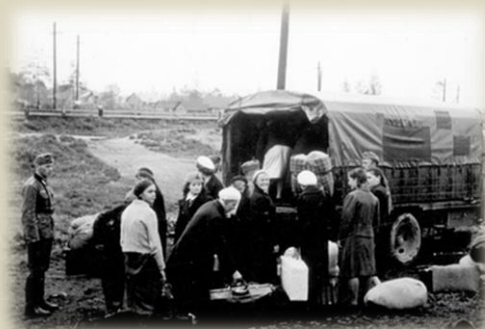
Жители оккупированной советской территории

Для публикации была разработана система, позволяющая комментировать тексты расшифровок, привязывать их фрагменты к сквозным указателям: тематическому, географическому и именованному. Наша система открыта для всех и может быть использована для любого из проектов региональных центров.