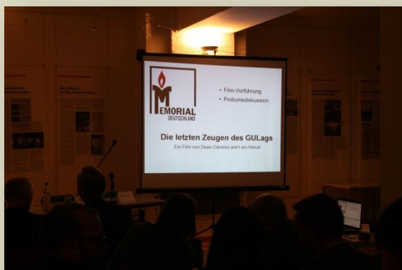
Презентация в Берлине

М емориал Германия устроил премьеру - первую презентацию фильма «Последние свидетели ГУЛАГа» в Берлине - и потом ещё вторую презентацию в Кёльне (совместно с форумом Льва Копелева).