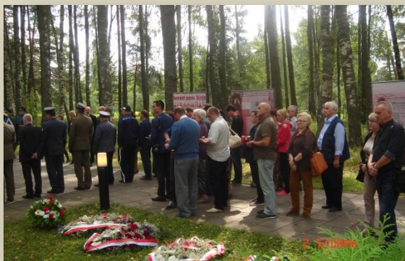
Церемония в Мемориальном комплексе «Медное»