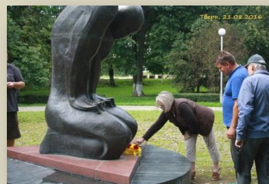
Возложение цветов к памятнику жертв политических репрессий

лейтмотивом которых было понимание того страшного опыта, который получили в XX веке народы Польши и России, и той непомерной цены, которой был оплачен этот опыт.