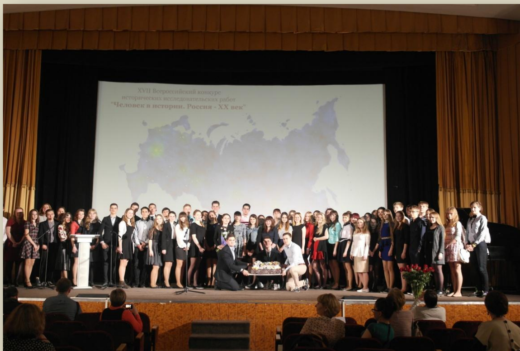
Церемония награждения победителей XVII конкурса работ «Человек в истории XX век»

Участниками конкурса могут стать учащиеся общеобразовательных учреждений, учреждений среднего профессионального и высшего образования России в возрасте от 14 до 18 лет.