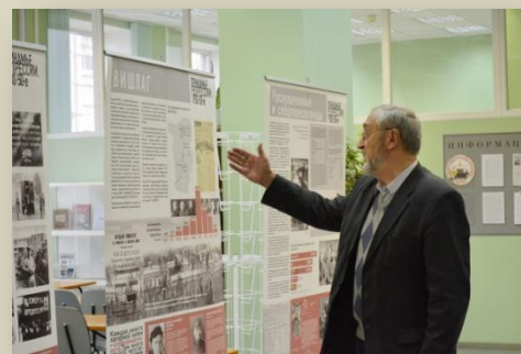
Выставка «Прикамье. Репрессии. 1930 – 1950-е годы».

Так, 13 сентября в Пермской краевой библиотеке им. А. М. Горького состоялось открытие выставки «Прикамье. Репрессии. 1930 – 1950-е годы». Эта выставка была создана коллективом Мемориального центра «Пермь-36» и готова к показу ещё в 1999 году. Это один из успешных продуктов деятельности этой организации. По словам авторов, с момента создания все материалы не раз демонстрировались не только в Перми и Пермском крае, но и за его пределами. В краевой библиотеке уже полным ходом идут экскурсии .