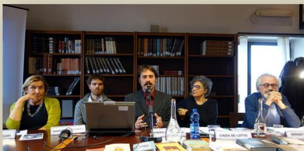
Выставка о В.Шаламове. Università degli studi di Verona, 14.01.2015

С 2011 г. Ассоциация организует в итальянских вузах семинары на тему прав человека в сотрудничестве со специалистами по правам человека из Университета Сиены. Для участия в этих мероприятиях и улучшения знаний в области прав человека и гражданского общества приглашаются известные эксперты.