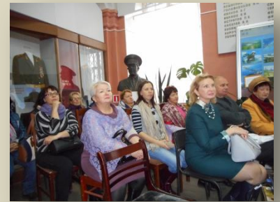
Участники встречи в Вяземском историко-краеведческом музее