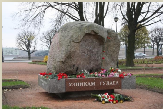
Соловецкий камень на Троицкой площади, С. Петербург

В 2002 усилиями НИЦ был доставлен с Соловецких островов и поставлен на закладную плиту, установленную в сквере на Троицкой площади еще в 1990, «Соловецкий камень» – гранитный валун, сразу же ставший главным мемориальным памятником Санкт-Петербурга и одним из центров уличной общественно-политической активности.