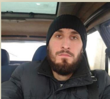
Пострадавший житель Хасавюрта, республика Дагестан

Граждан массово ставят на профилактический учет в качестве потенциальных террористов. Поводы для постановки на учет бывают самыми разными — принадлежность к определенным течениям в исламе, борода определенной длины или определенная одежда. Очень часто они не имеют никакого реального законного обоснования.