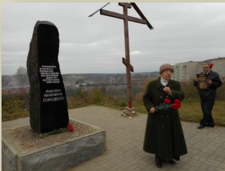
Памятный знак жертвам террора