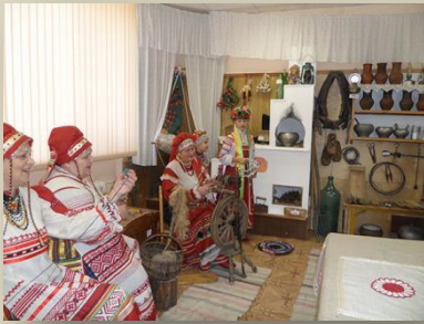
Беженцы в народных костюмах заняты рукоделием