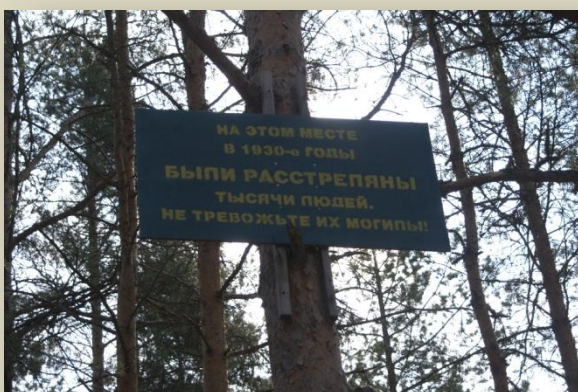
Урочище Койракангас, Ленинградская обл.

НИЦ ведет активную выставочную деятельность. Созданные им передвижные выставки «Ленинград-Воркута», «Между двух диктатур», «История одного расстрела», «Места польской памяти на территории России» и другие с успехом экспонируются в разных регионах Российской Федерации и за рубежом.