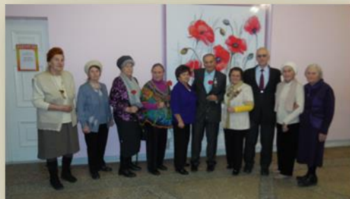
Встреча с реабилитированными

Четвёртый этап включает в себя презентацию книги и фильма в институтах и колледжах, проведение читательских конференций, награждение участников проекта.