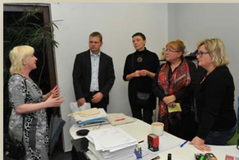
Визит в Институт по изучению тоталитарных режимов