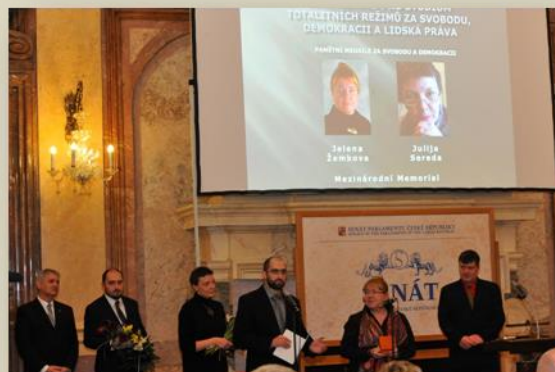
На церемонии награждения Общества «Мемориал» Премией «За свободу, демократию и права человека»

"Уже почти тридцать лет Общество Мемориал исследует историю советских репрессий и уровень прав человека в современной России. Таким образом, в значительной степени замечая деятельность Российского государства, которое, особенно в последнее время, не склонно к критическому взгляду на прошлое и надзору над соблюдением прав человека. Тем более ценной является работа Мемориала и его сотрудников по всей России, которые, несмотря на нарастающее давление со стороны государственных органов, продолжают свою неоценимую деятельность. Работа Мемориала обрела огромный авторитет среди историков и специалистов в целом мире. Без деятельности Мемориала мы бы никогда не узнали столько подробностей о советских репрессиях, направленных против чехословацких граждан", обосновал вручение Премии Институт по изучению тоталитарных режимов.