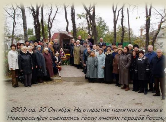
2003 год. 30 Октября. На открытие памятного знака в Новороссийск съехались гости многих городов России.