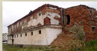
Остатки тюрьмы постройки начала 40-х гг XXв.

Что касается мемориального комплекса, то рабочая группа приняла решение о его создании в здании бывшей пересыльной тюрьмы постройки 1940-х годов, находящемся на территории города Магадана. После заседания был организован выезд к этому сооружению и его визуальное обследование. Объект произвёл определённое впечатление на всех «экскурсантов» и в ближайшие три года может стать своеобразным мемориальным комплексом, посвящённым истории Дальстроя и Магаданской области, в т. ч. и печальной странице нашей истории – репрессиям.