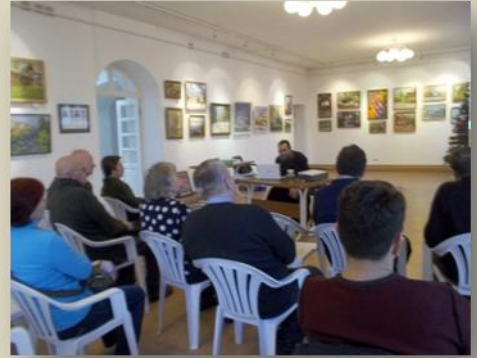
На презентации биографий братьев Трубецких, в Галерее «Ясная Поляна», г.Тула

Трубецкие – это «князья русской философии», выдающиеся представители метафизики всеединства, родоначальники отечественной историко-философской традиции.