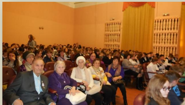
На презентации книги Памяти

Со школой №12 заключён договор о сотрудничестве, один предприниматель выделил средства на подписку местной газеты "Муромский край" нескольким членам организации.