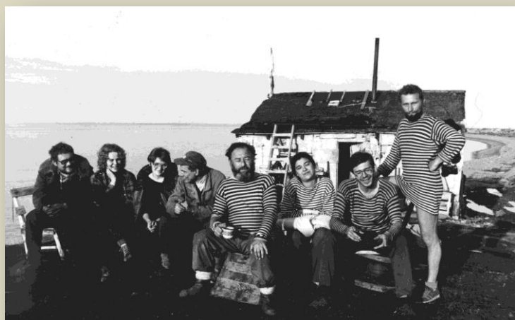
Нордвикская экспедиция. 1990 г.

Кроме сайта, есть ещё электронный архив в «облаке», в котором сейчас больше трёхсот гигабайт. «Облако» позволяет работать с нашим архивом из любого места. К нему имеют доступ все красноярские мемориальцы, а также мы даём возможность работать с ним журналистам и исследователям. Работа по оцифровке и выкладке в «облако» мемориальского архива идёт уже двадцать лет и близится к завершению. Новые материалы, как правило, поступают сразу в электронном виде.