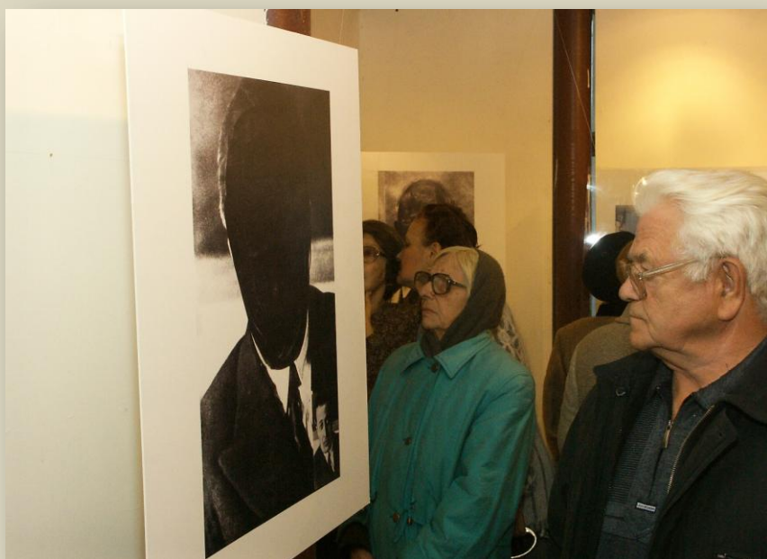
Выставка "Отретушированная история"

В девяностых-двухтысячных годах, после выхода закона «О реабилитации жертв политических репрессий», Красноярский «Мемориал» проделал большую работу по консультированию и юридической поддержке жертв политических репрессий. В нашем крае было много ссыльных (порядка миллиона), как следствие, было много запросов о помощи с реабилитацией. Мы помогали с составлением запросов в архивы, составляли искивые заявления и т.п. Эта работа естественным образом сочетается с проведением опросов, сбором фотографий, документов и воспоминаний.