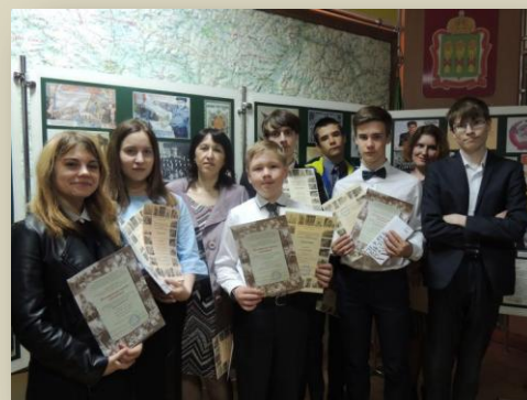
Лауреаты Всероссийского конкурса «Человек в истории. Россия – ХХ век».