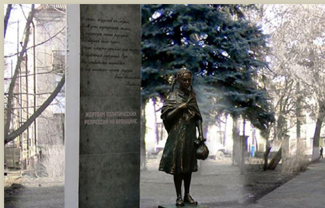
Проект памятника жертвам сталинских репрессий

Мы надеемся на поддержку жителей. В СМИ уже опубликовали реквизиты, куда перечислять средства.