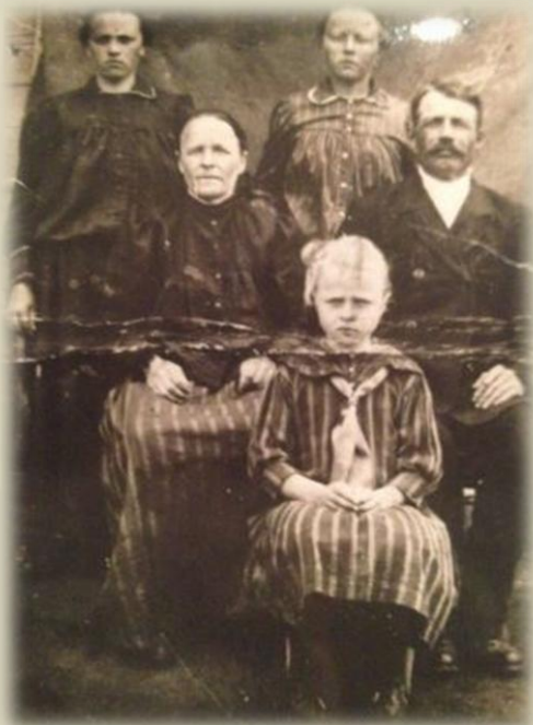
Немецкая семья Колпин

М ЕМОРИАЛ Германия, в сотрудничестве с Научно-информационным центром «Мемориал» (СПб) и Istorine Atmintis (Вильнюс), до конца этого года осуществляет совместный проект. В нём исследуются сюжеты массовых депортаций русских немцев при Сталине, а именно последствия этих событий для детей депортированных. Потрясение, испытанное вторым поколением, – немаловажный источник для анализа нынешнего состояния культуры памяти вокруг советского террора. Наравне с личным и семейным опытом, память тесно связана с зарождением национальной идентичности. Эти взаимосвязи всё ещё должным образом не изучены в России, Литве и Германии.