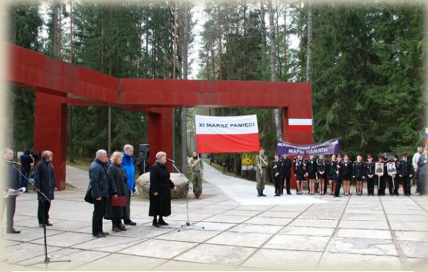
На открытии Марша памяти в МК «Катынь»