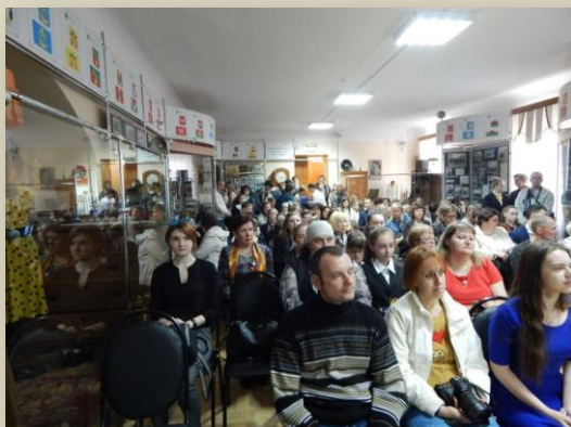
На церемонии награждения

На церемонию, из разных уголков Пензы и области, прибыли авторы работ и их наставники. Самые юные участники конкурса прибыли с родителями. Зал, рассчитанный на 60-70 человек, не смог вместить всех, и даже с учетом того, что люди стояли на галерке.