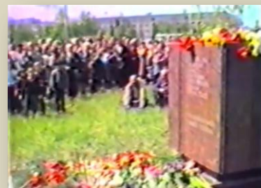
На церемонии установки Памятного знака 20.03.1990

Памятный знак был установлен совместно Куйбышевским горисполкомом и Куйбышевским обществом «Мемориал» по инициативе последнего. Создание памятного знака стоило около семи тысяч рублей (примерно стоимость тогдашних ВАЗовских «Жигулей»), одна тысяча из которых – пожертвования граждан, поступившие на счёт Куйбышевского «Мемориала».