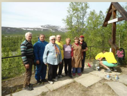
Члены Хибинского общества «Мемориал»

9 июля, очень долгожданный в этом зябком холодном лете 2017 г., тёплый солнечный день собрались три поколения кировчан на совместный субботник: члены Хибинского общества «Мемориал» и молодежь организации АО «Апатит».