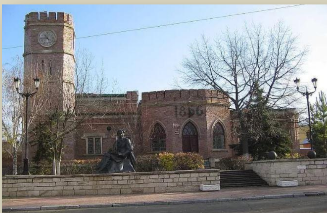
Музей истории города Оренбурга

Так в Оренбурге прошло 8 июля – День Памяти репрессированных и захороненных в Зауральной роще, где вповалку лежат с раной в затылке невинные жертвы тоталитарного режима, реабилитированные посмертно 7414 человек. Кто ответственный за мероприятие – не поняли. Всё было скомкано, не сердечно, в спешке.