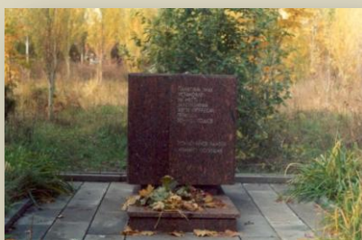
Памятный знак жертвам политических репрессий. Самара, парк им. Ю. Гагарина (бывшая территория дач НКВД).

То, что место, где в последующем был установлен памятный знак, является местом захоронения жертв репрессий, стало известно по информации, поступившей из управления КГБ СССР по Куйбышевской области. Раскопок не проводилось. «Мемориальцы» считали, что проведение раскопок было бы целесообразно, но это мнение не стало мнением большинства тех, кто участвовал в принятии решения о создании памятника. В том, что жертвы политических репрессий были, «мемориальцы» не сомневались. А где находятся могилы их безвинно погибших родных, многие не знали и не знают до настоящего времени. Поэтому «Мемориал» был в любом случае за создание памятного знака, за создание того символического места, куда люди могли бы прийти почтить память дорогих им ушедших.