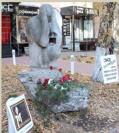
Памятник "Покаяние", скульптор Б.В.Качеровский

В есной этого года ушёл из жизни автор памятника "Покаяние", скульптор Борис Вениаминович Качеровский. Это был духовно очень близкий "Мемориалу" человек.