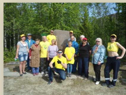
Участники совместного субботника: члены Хибинского «Мемориала» и молодежь АО «Апатит»

Узнать поближе историю рождения в труднейших условиях Заполярья любимого города Кировск (Хибиногорск), который начинался с палаток у горы Кукисвумчорр и одноимённого посёлка.