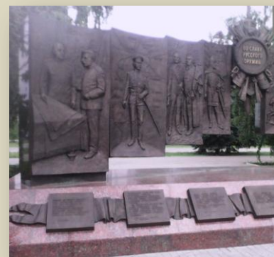
Памятник "Во славу русского оружия", Пенза

Работы велись в закрытом формате: вокруг памятника стояли леса и был натянут тент в несколько слоев, позволяющий вести работы и в зимний период, поэтому никто не ожидал подвоха. И 22 июня огромное количество людей испытали фактически шок, так как фигура Сталина всё-таки присутствует на памятнике, но не в центре, а с левого края, как бы прикрытого ветками дерева... Но он есть.