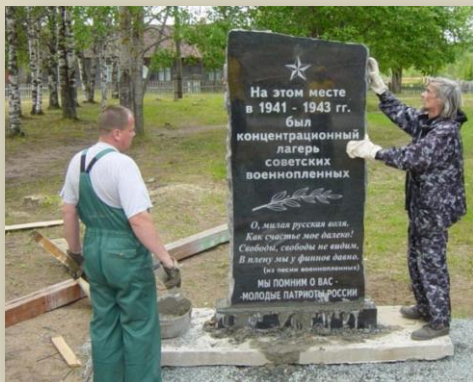
Установка памятника в Ковере Олонецкого района