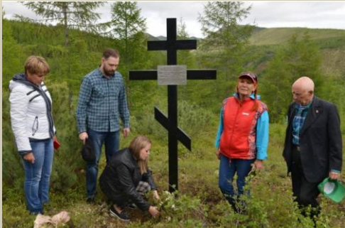
Правнучка возлагает цветы у памятного креста. Кладбище лагеря «Ленковский», 25.06. 2017