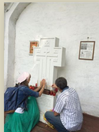
Молодежное служение у Поклонного креста

Проведённая владимирскими мемориальцами акция «Зажги свечу снова!» напомнила обществу, что раны, нанесённые репрессиями, несмотря на прошедшие годы, кровоточат, и ещё долго будут напоминать обществу о тех миллионах лучших людей, безвинно пострадавших и безвременно ушедших... Вечная им память!