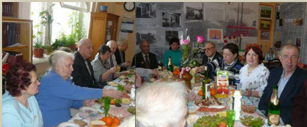
Бывают у нас и праздники. По-студенчески, вскладчину.