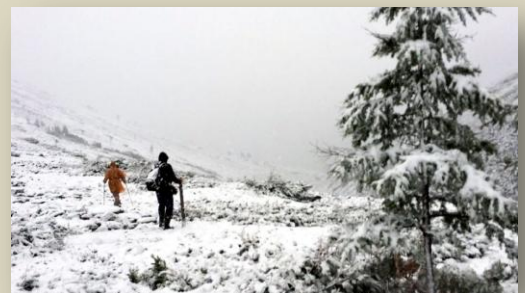
Спуск с верхнего лагеря 30 июля 2017 г.

Самым страшным для нас в этот день – разгар лета – была... метель. К семи часам вечера пошёл дождь, к полночи перешедший в снег. Пришлось заночевать в одном из сохранившихся лагерных строений, а утром, в половине шестого, двинуться в обратный путь по... сугробам (сантиметров 20-30) в обратный путь... В следующее лето мы вновь планируем экспедицию сюда, точнее, в соседний женский лагерь «Вахханка».