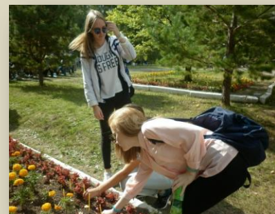
Возложение цветов к Мемориалу жертвам политических репрессий

Миллионы людей лежат по всей нашей стране. Невинно убиенные, умученные, расстрелянные. Кровь сотен тысяч мучеников обагрила нашу землю. Мы помним их и скорбим о них. Мы молимся о них, ибо им нужна наша молитва, и в них мы видим наших заступников. Мы будем помнить эту скорбь, эту боль и будем завещать эту память нашим потомкам для того, чтобы этот ужас никогда не повторился.