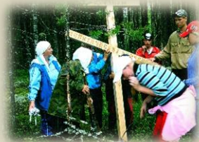
Архив Сыктывкар: Установка памятного креста, 2007

Нам бы очень хотелось, чтобы этот архив использовался в качестве просветительской площадки и был полезен как интересующейся публике, так и специалистам или журналистам, ищущим материалы для работы.