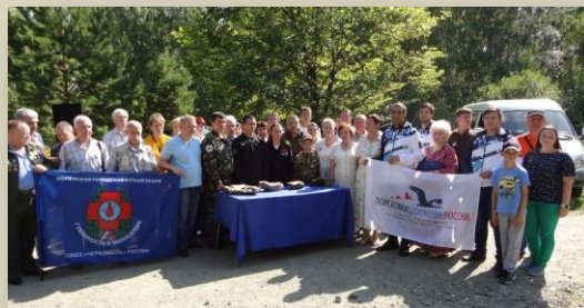
Камни для «Стены Скорби»

Жители Челябинска передали камни с «Золотой горы» для строительства монумента жертвам политических репрессий в Москве «Стена скорби», который будет открыт 30 октября 2017 года.