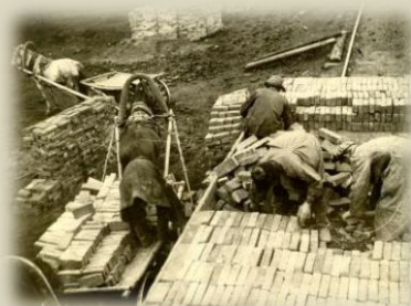
Погрузка заключёнными кирпича, 1930-х г.

И, конечно, отдельная благодарность Фонду осмысления диктатуры СЕПГ (Германия) за финансовую поддержку проекта.