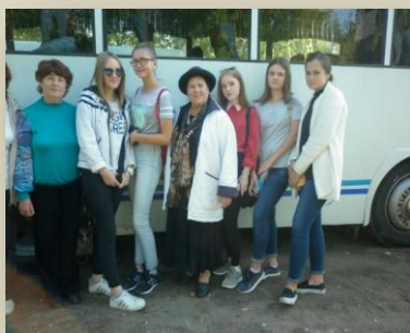
Делегация Курганского Мемориала

Курганский Мемориал сохраняет и чтит память безвинно пострадавших.