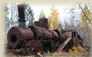
Архив Прага: Брошенный паровоз у «Мертвой дороги», 2013