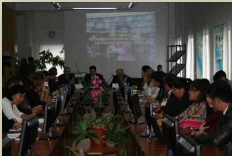
Круглый стол «Большой террор. Трагедия Приуралья»

Мероприятие инициировали: общественное объединение «Адилет», (г. Алмата), общественное движение «За свободный доступ к архивам ВЧК, НКВД, КГБ» и Казахстанский Университет Инновационных и Телекоммуникационных Систем (г. Уральск).