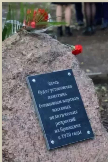
Закладной камень в центре Брянска

За любое «иное» высказывание исключали из партии, лишали работы, жилья, а дела - в НКВД, и пулю в лоб! В апреле 1936г. 1-й секретарь Западного обкома ВКП(б) И.П. Румянцев направил в районы письмо с указанием особого контроля за исключенными из партии. В октябре 1937 он и сам был расстрелян. До этого, в июле, был расстрелян командующий Белорусским военным округом И.П. Уборевич.