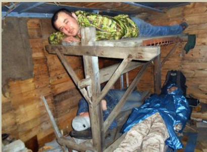
Бутугычаг, ночёвка, 29.07. 2017 г

а остатки лагеря (не пионерского, конечно) «Бутугычаг», находившегося в 1930-50-х годах на территории Дальстроя (Магаданская обл.), сегодня можно абсолютно беспрепятственно попасть, если игнорировать в начале дороги на рудник таблички следующего содержания: «Запрещается пить воду из прилегающих ручьёв» и «Внимание! Отмечается повышенный радиационный фон».