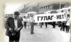
Первый митинг в Красноярске, 1988

Проект осуществлён усилиями многих коллег из разных регионов.