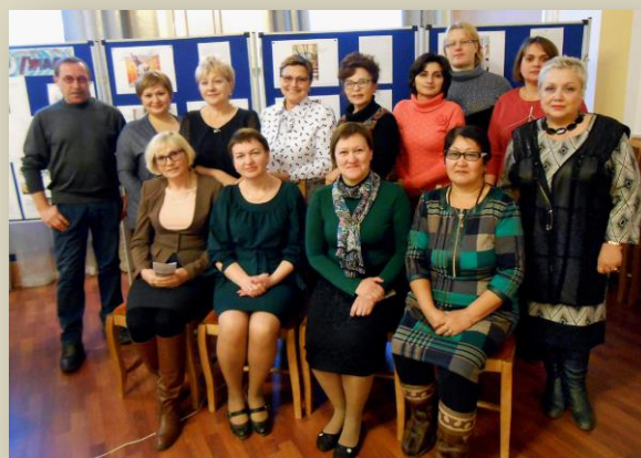
Участники конференции "Колымская Голгофа", пос. Ягодное Магаданской области 27.10.2017

Остается надеяться на серьёзность этих заявлений и стремлений.