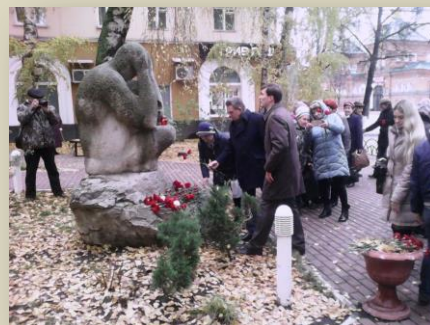
Памятник жертвам политических репрессий «Покаяние» г.Пенза