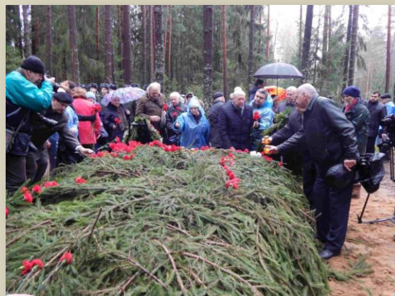
Перезахоронение останков людей, расстрелянных в Катыни в 1937г.

В перезахоронении приняли участие представители Государственного центрального музея современной истории России, Министерства культуры РФ, Смоленской областной Думы и Городского Совета, а также общественных организаций, в том числе Смоленского отделения Международного общественного фонда «Российский фонд мира», Смоленского отделения Общероссийской общественной организации инвалидов, жертв политических репрессий, СРОО «Латышское землячество «Сакнес». Были и потомки жертв политических репрессий, чьи родные покоятся в Катынском лесу.