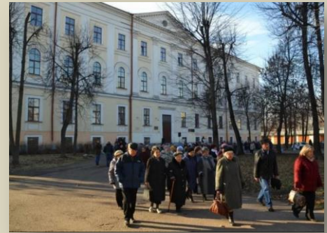
Медицинская академия г.Тверь

В тот же день у храма Покрова Богородицы и у памятника Салтыкову-Щедрину в Твери состоялась ежегодная акция «Молитва памяти». Акция прошла под эгидой Тверского Боголюбского братства, приняли в ней участие и члены Тверского «Мемориала». Акция «Молитва памяти» – это чтение имен погибших и пострадавших в годы репрессий. Ее участники читают имена и молятся о безвинно пострадавших и погибших соотечественниках.