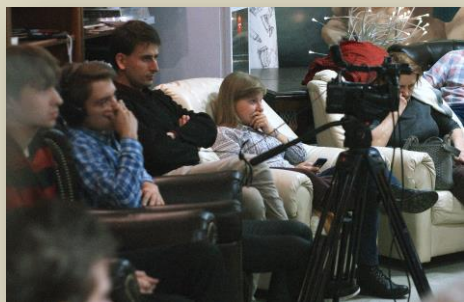
Документальные кадры о сталинском терроре произвели сильное впечатление на молодых людей.

Психолог Евгений Габелев говорил об отпечатке, наложенном советским террором на современное российское общество: "Лучшее, что мы можем делать - разрушать систему передачи знаний, которая передает установки: нельзя высовываться, нельзя договариваться, опасно иметь свое мнение. Любое общественное событие, любая дискуссия, любая попытка договориться разрушает последствия массовых репрессий. Прежде чем наша страна радикально изменится, нам предстоит разрушить эту матрицу.