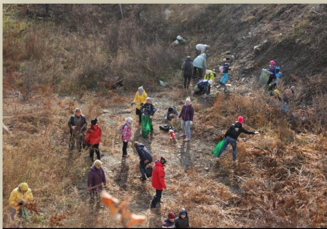
Субботник у первого тоннеля БАМа. 20.10.2017.

В прошлом году Комсомольское-на-Амуре общество "Мемориал" составило список жертв политических репрессий, захороненных на лагерных кладбищах Комсомольска и окрест его, и приняло участие в акции "Возвращенные имена", присоединив ее к общему комплексу мероприятий, которые проводятся в течение ряда лет. В этом году все мероприятия, посвященные памяти жертв политических репрессий, были проведены вновь.