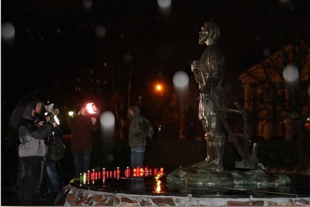
У памятника Тамбовскому мужику – жертве Гражданской войны на Тамбовщине в 1920 – 1921 гг.