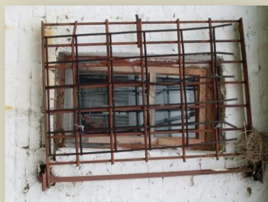
Окно камеры штрафного изолятора на строгом режиме зоны "Пермь-36"

Оставляя вас в сих «рамках», с которыми я не могу иметь ничего общего, Михаил Мейлах»