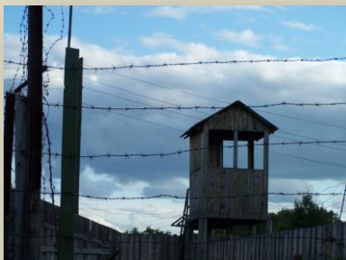
Лагерная вышка и ограждения на участке особого режима