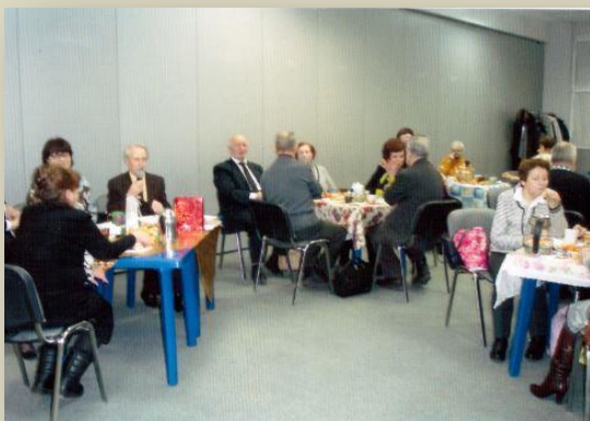
Встреча активистов Владимирского Мемориала

Таковыми словами открылась традиционная после наступления Нового года и Рождества встреча «От всей души» активистов Владимирского регионального отделения Российского «Мемориала». Собралось около 40 истинных энтузиастов общественного движения в возрасте от 65 до 92(!) лет. Среди них особо отмечены юбиляры декабря 2017 и января 2018 годов.