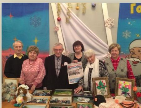
Активисты Владимирского Мемориала на выставке «Золотых рук мастерство»

А 13 января в Доме культуры молодёжи состоялась ежегодная выставка «Золотых рук мастерство». Так встречают Старый Новый год владимирские общественники: в этом году на празднике собралось более 400 человек, в празднике приняли участие и представители Владимирского отделения «Мемориал».