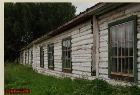
Барак заключённых строгого режима зоны "Пермь-36"