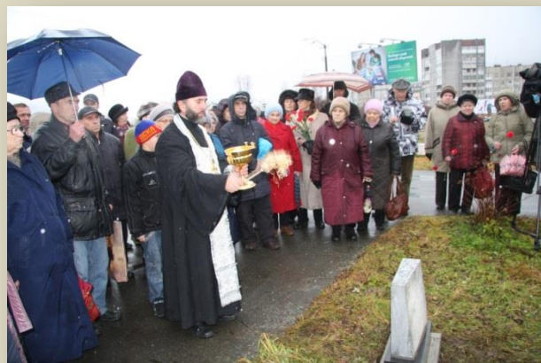
У закладного камня, г.Кировск

29 октября 2017 г в городе состоялись памятные мероприятия. Потомки спецпереселенцев, и другие жители города собрались у закладного камня, установленного в 2011 года на улице Кондрикова, на котором написано: «Здесь будет памятник спецпереселенцам, построившим город».