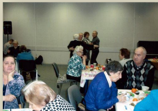
На встрече «От всей души»

Жажда общения, равнодушие, желание сделать доброе дело окружающим объединяет этих людей, составляет часть их жизни. Организаторы встречи - члены Правления - сделали так, чтобы люди за чашкой чая могли поделиться друг с другом своими радостями и тревогами, высказать «от всей души» свои поздравления и пожелания в наступившем году, послушать по заявке свою любимую песню.