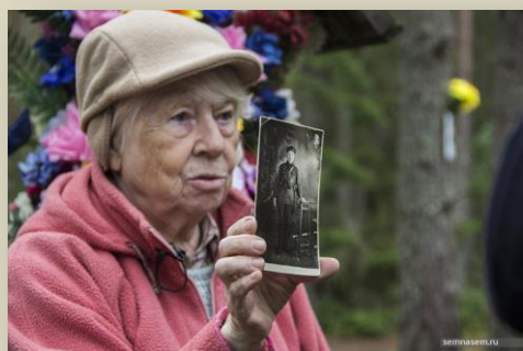
Внучка репрессированного поляка

Весной 2017 года состоялся блог-тур «Коренные народы ХМАО». Он был посвящен проблемам коренных народов, на традиции и культуру которых влияют нефтедобывающие компании. Партнером поездки стал «Гринпис России», публикации вышли не только в российских СМИ, но и в «The Guardian». Участники третьего блог-тура «Новосибирская Монстрация» побывали на набирающей популярность массовой демонстрации с абсурдными, аполитическими и концептуальными лозунгами и транспарантами, которая пародирует политические демонстрации.