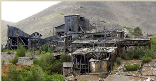
Каньон, обогатительная фабрика

В лето 2017 года я побывал на шести (!) остатках лагерей, о двух из которых «Ленковом» и «Бутугычаге» уже рассказывал в предыдущих «Мемориальных хрониках».