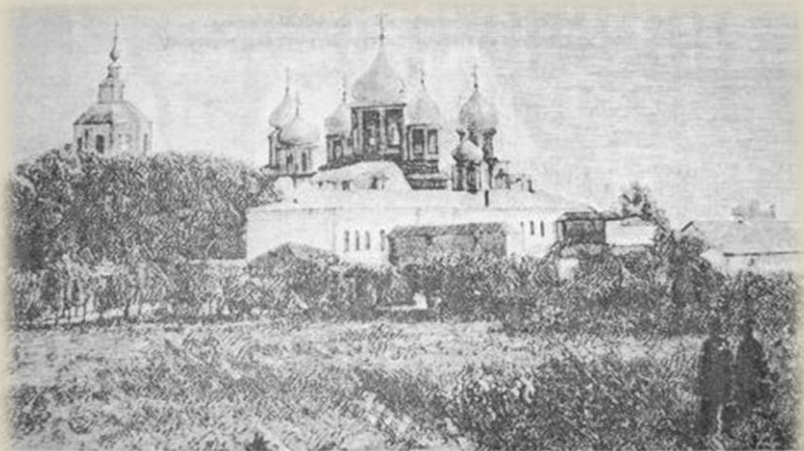
Общий вид Карачевского Николо-Одринского монастыря. Фото. 1908 г.