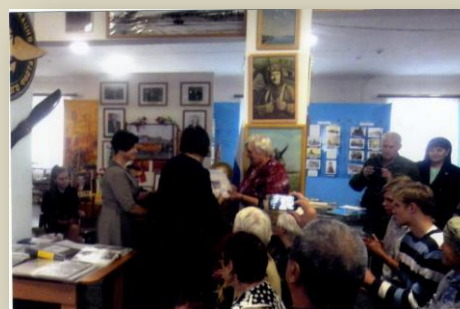
Открытие экспозиции «Следы ГУЛАГа в Артеме» к 80-летию «Большого террора»