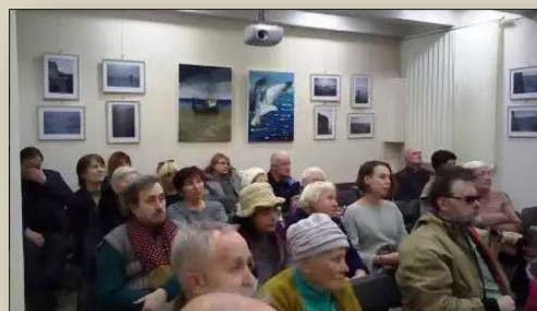
XV конференция Одесского Мемориала

Чтобы вести изыскательские работы, получать материалы из архивов других стран, нужна дружная и слаженная команда энтузиастов, которой должен теперь стать «Одесский Мемориал».