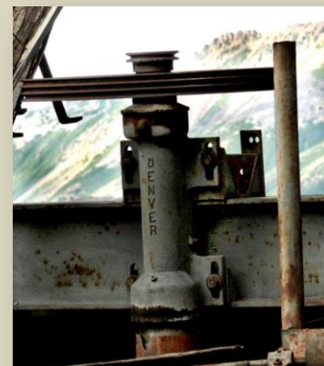
Агрегат фирмы «DENVER», США, Каньон, 02.09. 2017 г

Он оказался интереснейшим собеседником, знающим о прошлом Колымы довольно много, как никто другой из тысяч, приезжавших ко мне в прошлые годы – с 1991-го. И его товарищи тоже, как я считаю, патриоты, коль решили скитаться по крутым сопкам и осыпям, буйным зарослям лиственниц и кустарника, топким болотам и бурным речкам ради того, чтобы увидеть своими глазами... историю