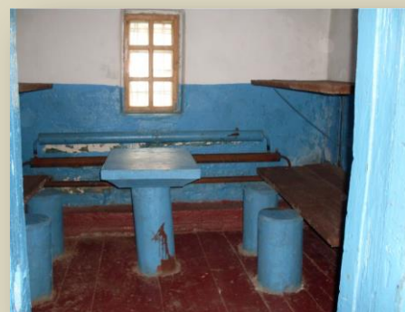
Камера штрафного изолятора на строгом режиме зоны "Пермь-36"

Что касается профессионализма, то полностью непрофессионально, например, произведена реставрация особой зоны. Выставки в музее посвящаются чему угодно – Колыме, Воркуте (это было когда-то давно и где-то далеко – сталинские «перегибы»...) – всему, кроме истории, быта и судеб обитателей зоны «Пермь-36» и соседних политзон, злоупотреблений КГБ и много другого. И это понятно: как же может быть иначе в насильно огосударствленной зоне-музее, где камни вопиют, а надо «в рамках концепции государственной политики» заткнуть им рот? Поэтому в полностью сохранившемся карцере не найдешь доски памяти чудесного армянского мальчика, который там повесился. И даже пояснения, что такое пониженная норма питания для там находящихся, а в бараке – какая была температура зимой (а именно +6, поскольку большая часть тепла выводилась из кочегарки за зону по жилищам ментов).